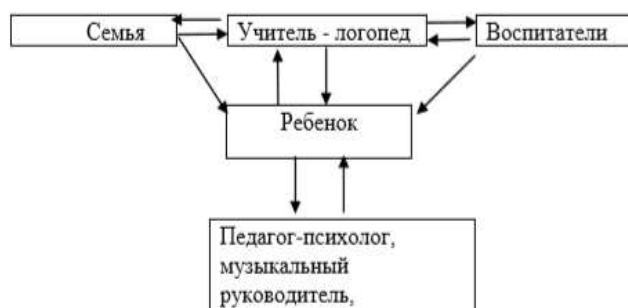
Модель взаимодействия субъектов коррекционно-образовательного процесса

Помимо традиционных физминуток на определенном этапе необходимо включать: режим смены поз, кинезиотерапию, психогимнастику, гимнастику для глаз и др.