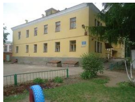
График работы группы: понедельник-пятница, с 7.00 до 19.00

Детский сад работает по Общей образовательной программе МБДОУ «Детский сад №226»