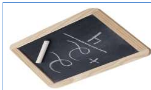
Доска и мел