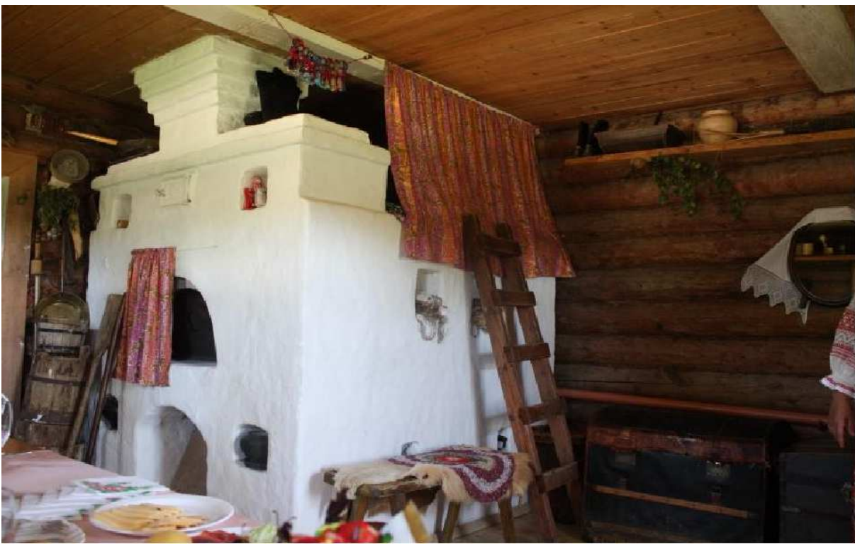
В каждой избе был Красный угол. Где находились иконы.(Иллюстрация)