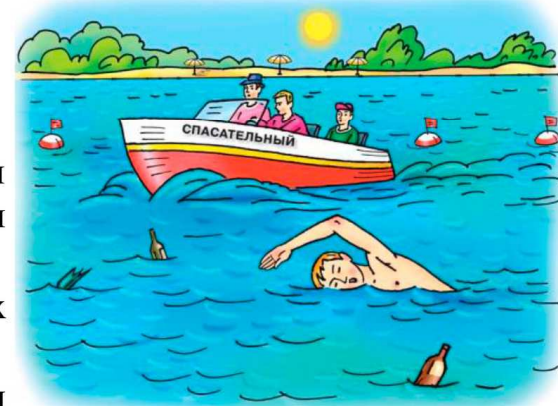
Не заплывайте за ограничительные знаки мест, отведённых для купания! Не подплывайте к большим судам, весельным лодкам, баржам.