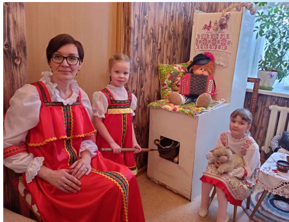
знакомство с предметами старинного русского быта