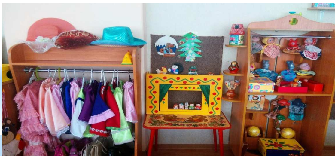
центр театральной деятельности