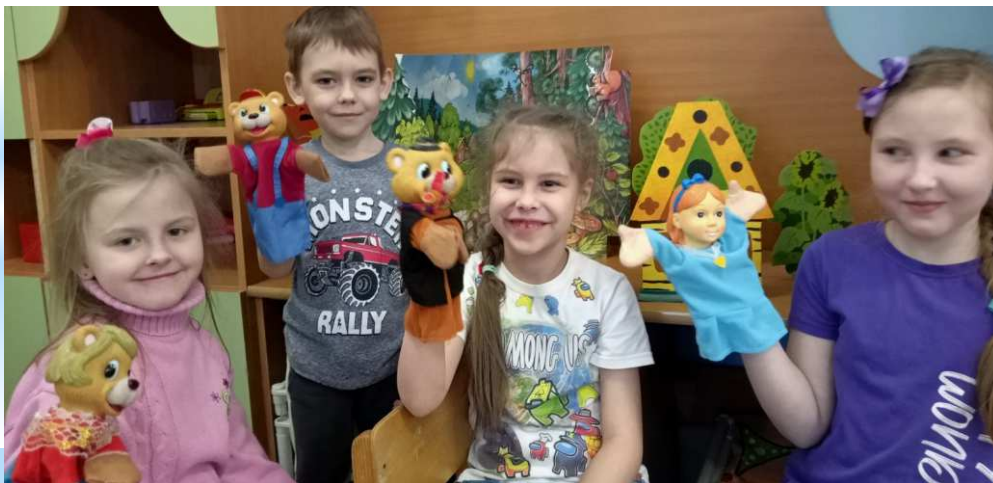
театрализованная игра по народной сказке «Три медведя»