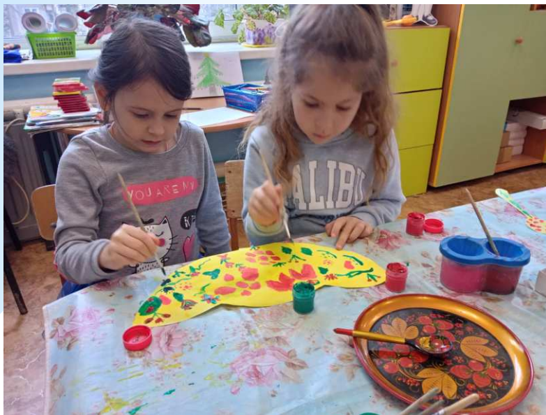
декоративное рисование по мотивам Хохломы «Ложечка точёная, ручка золочёная»