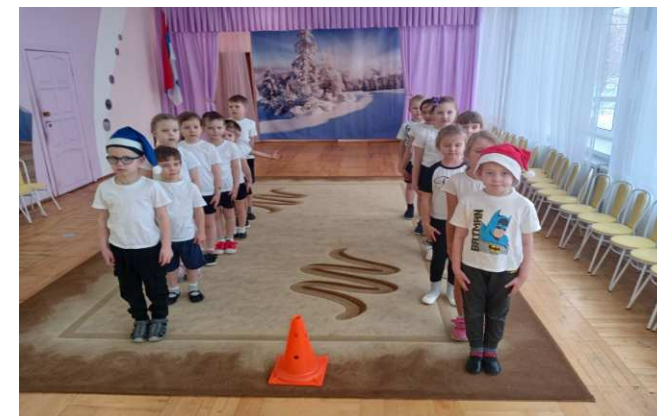
подвижная игра «Два Мороза»