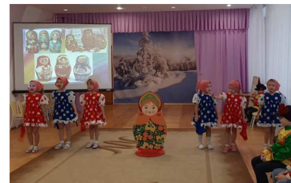
развлечение «Весёлые матрёшки»