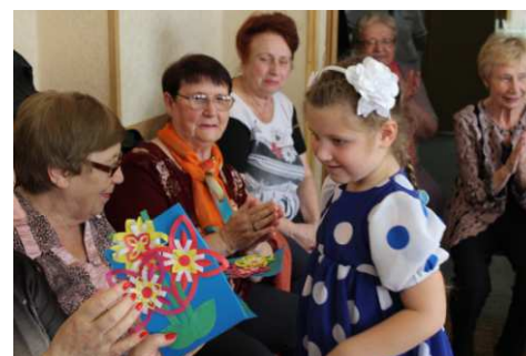
благотворительная акция «Из семьи с любовью»