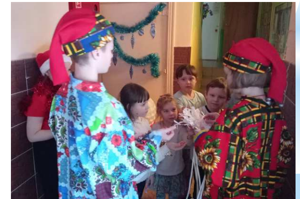
Игра «Взятие снежной крепости»