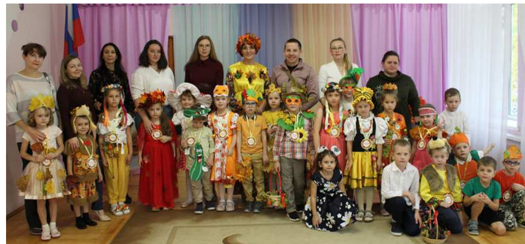
развлечение совместно с родителями «Осеннее дефиле»