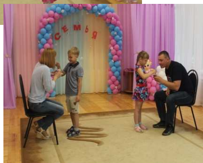
праздник с участием родителей «Красен обед пирогами, река-берегами, а семья-традициями!»