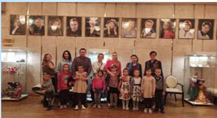
поход выходного дня «Театр кукол»