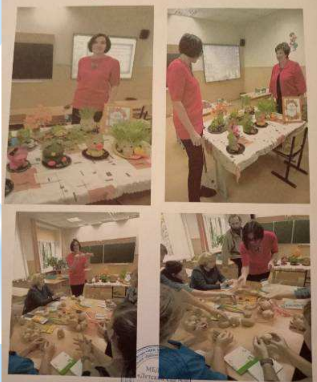
Транслирование опыта профессиональной деятельности с использованием современных технологий в рамках проведения мастер-класса