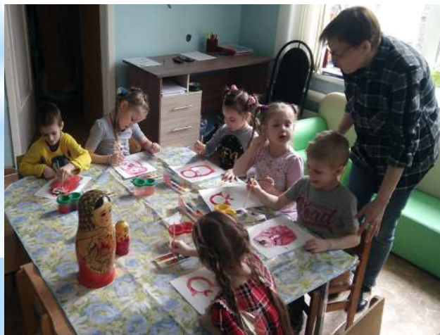
Творческие встречи с художниками Семёновской фабрики «Рисуем матрёшку»