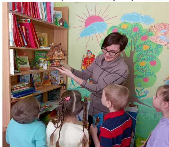
викторина «По тропинке сказок» в библиотеке ДОУ