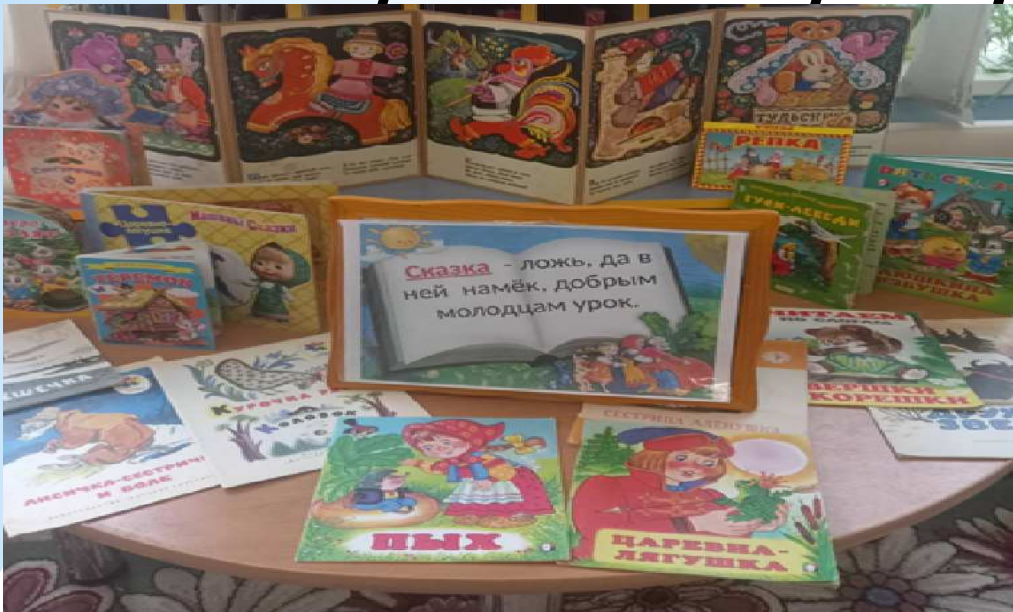
центр книги «Сказки народные»