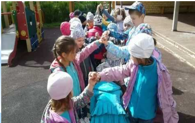
народная игра «Ручеёк»