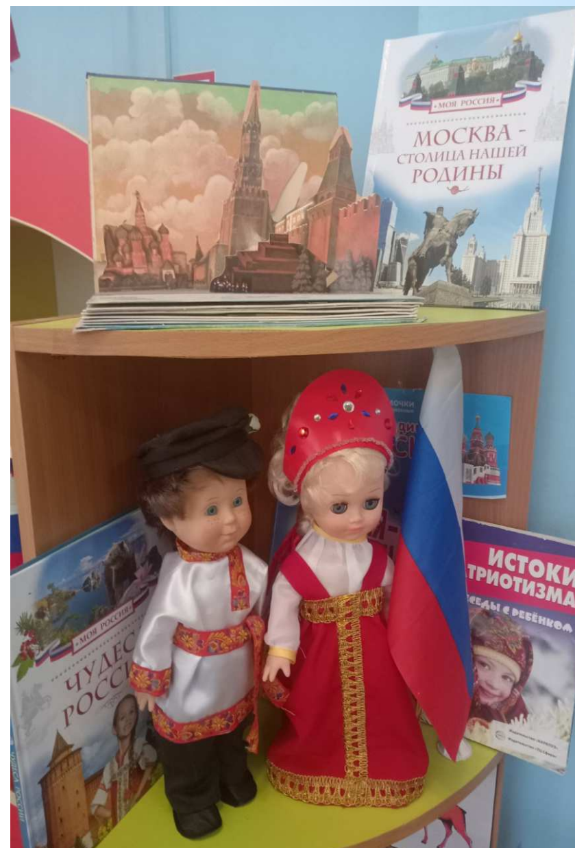
центр патриотического воспитания