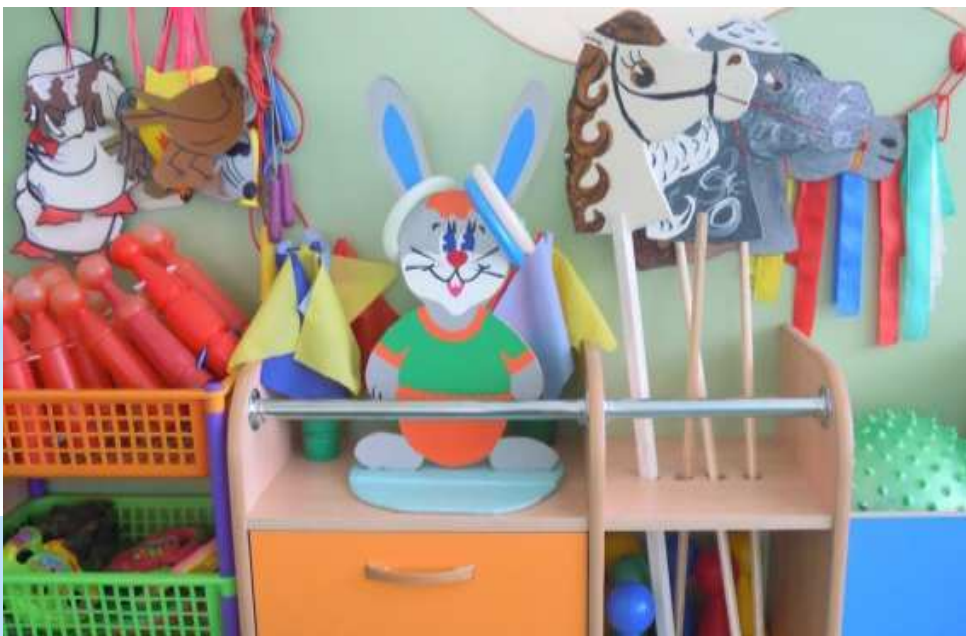
центр физического развития