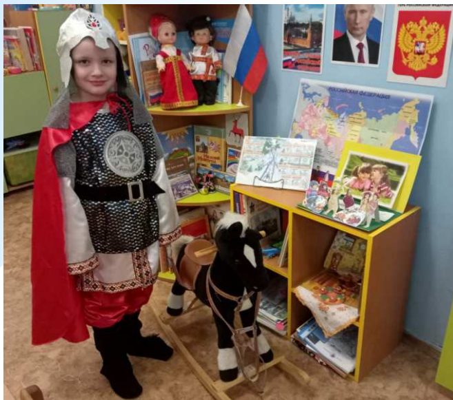
с/р игра «Защитники земли русской»