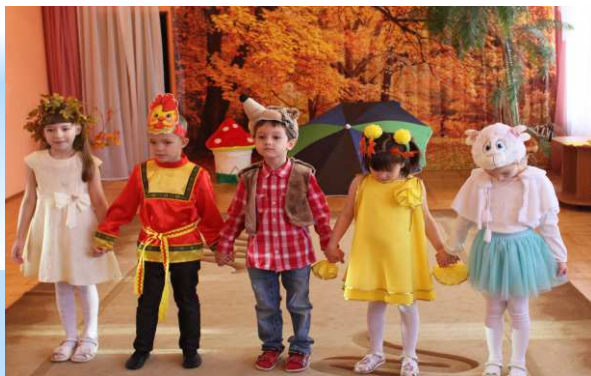
Игровая деятельность по русским народным сказкам