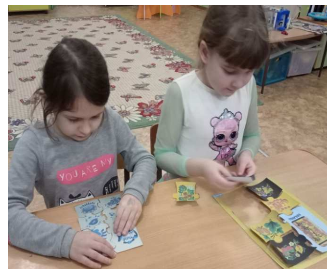
д/р игра «Русские узоры»