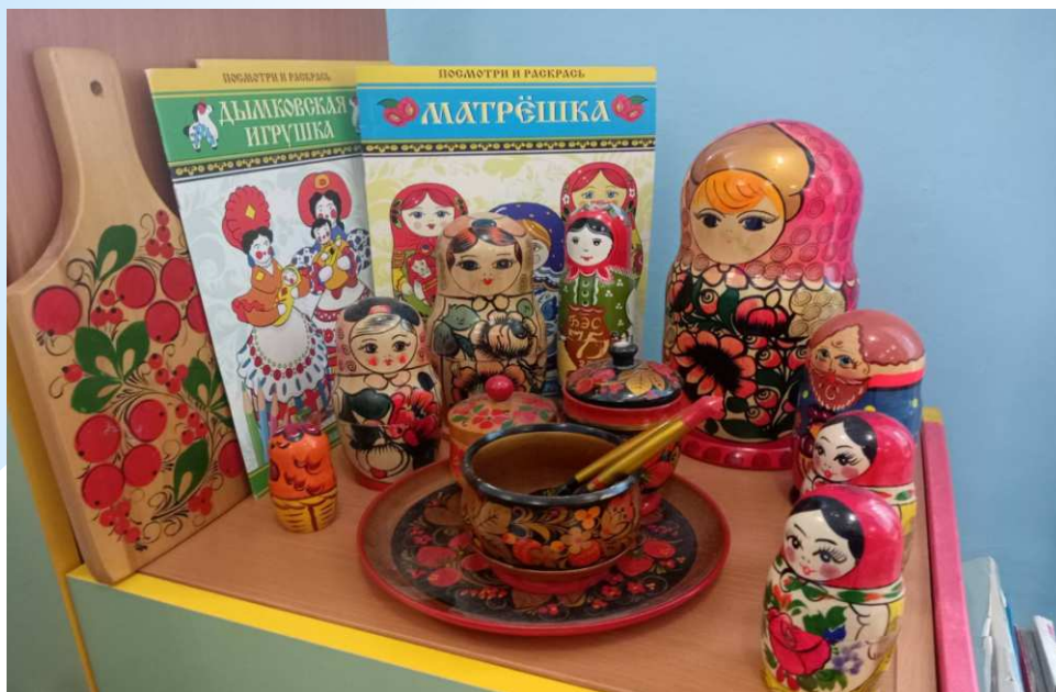
центр эстетического развития