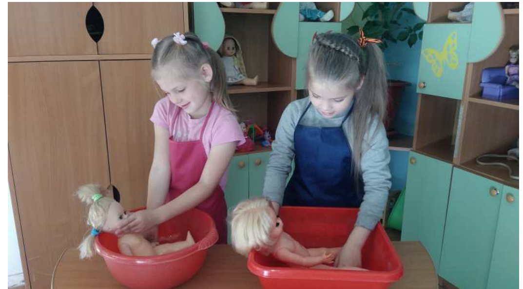
с/р игра «Дочки-матери»