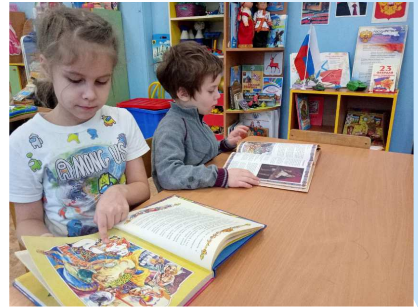
рассматривание сюжетных картинок «Русские богатыри»