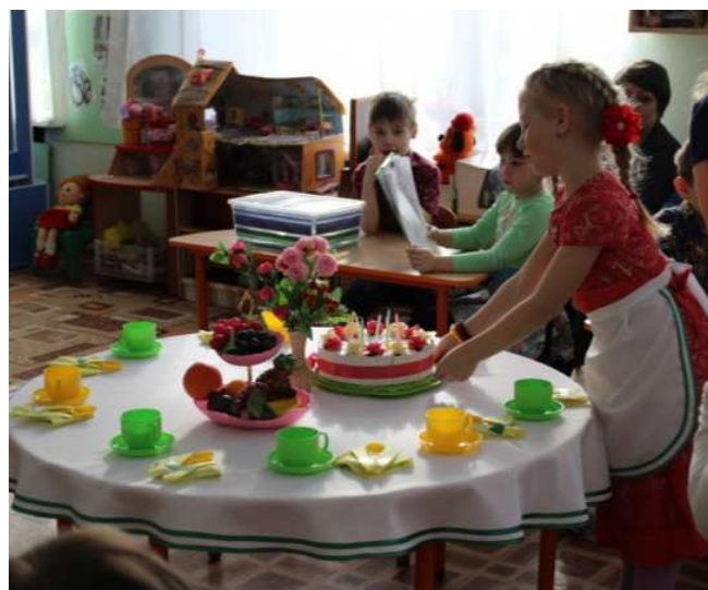
с/р игра «Встречаем гостей»