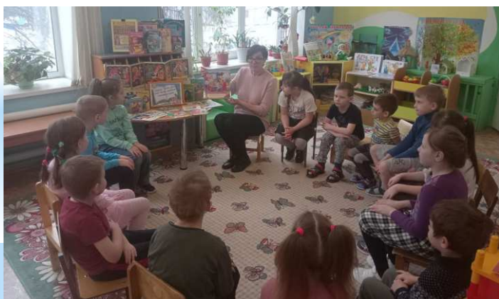
чтение русской сказки «Снегурочка»