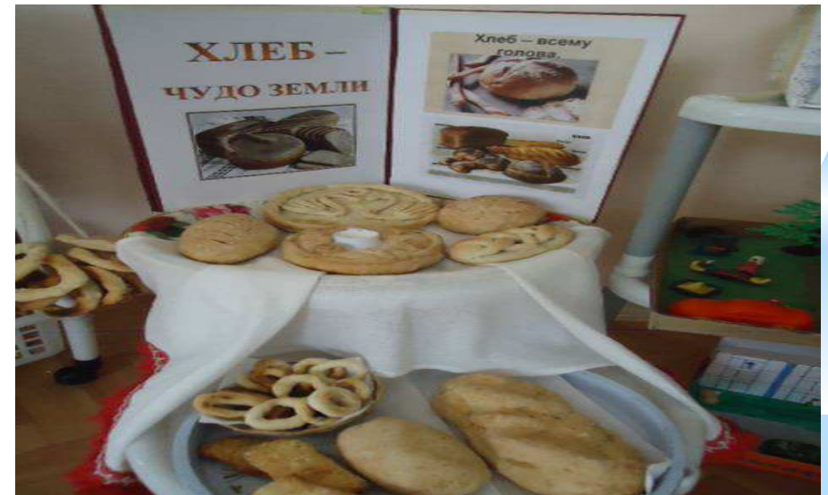
выставка «Хлеб-чудо земли»