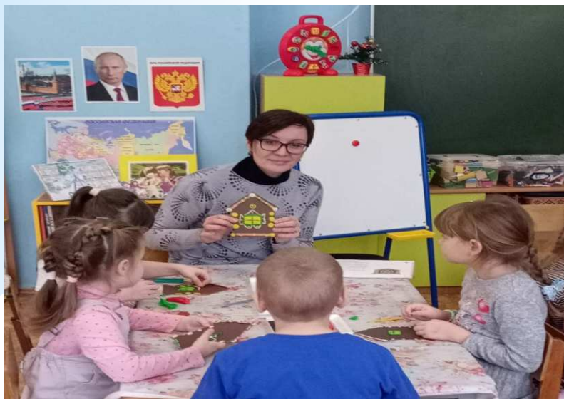
лепка «Окна расписные, ставенки резные»