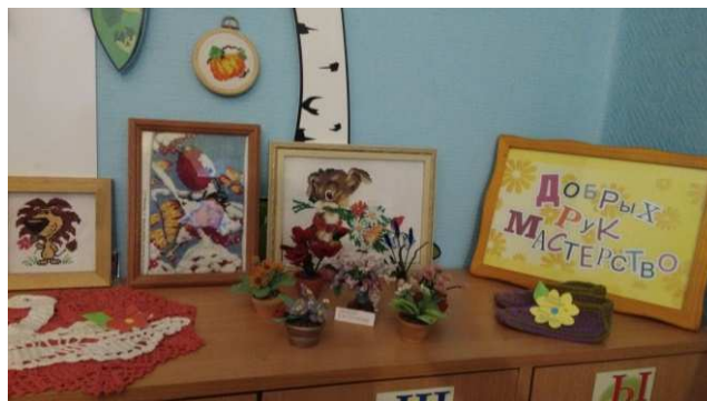
выставка «Добрых рук мастерство»