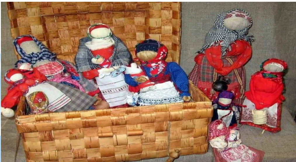
мини-музей «Куклы из бабушкиного сундучка»