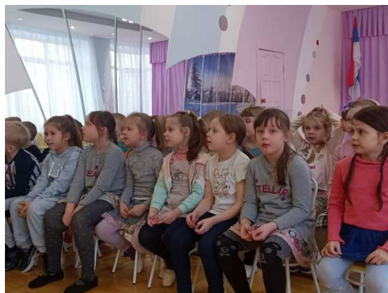
прослушивание народной музыки