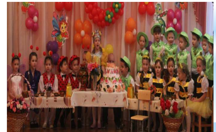
Медовый Спас «У пчёлки именины»