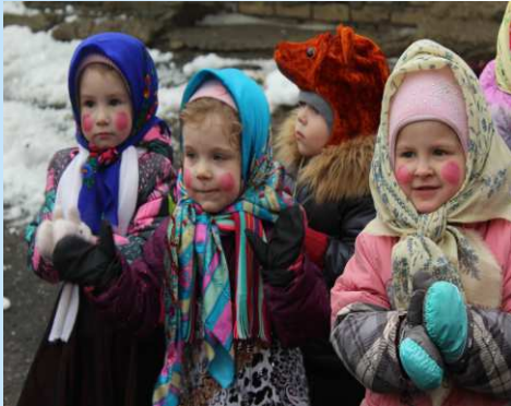
народное гулянье «Ух, ты Масленица, да ты-Затейница!»