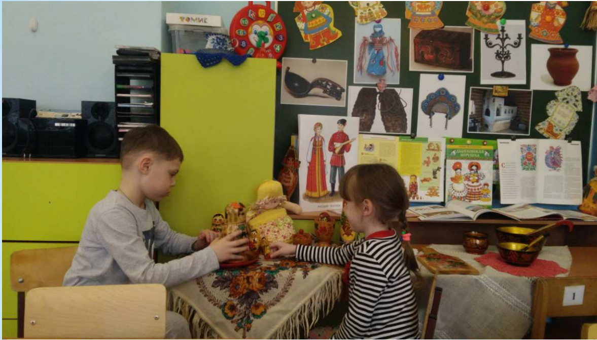
дидактическая игра «Весёлая матрёшка»