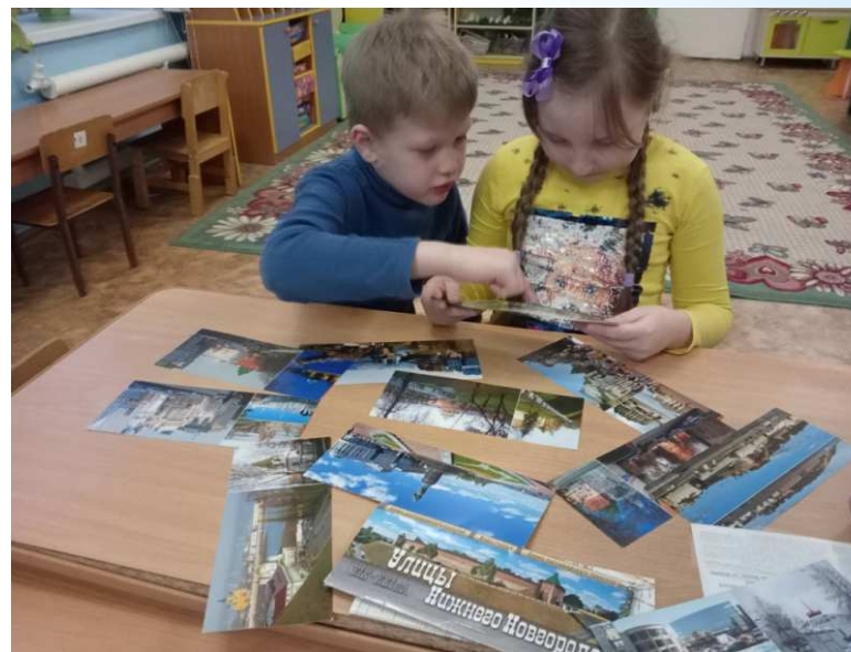
рассматривание фотографий и открыток