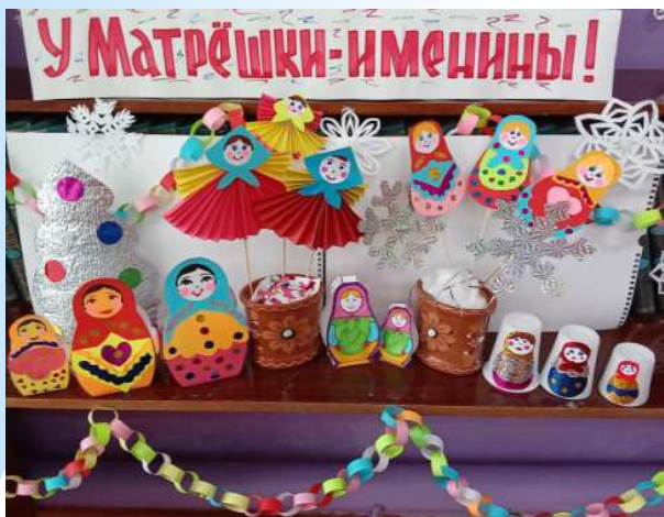
выставка детского творчества