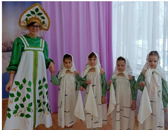
Праздник русской берёзки