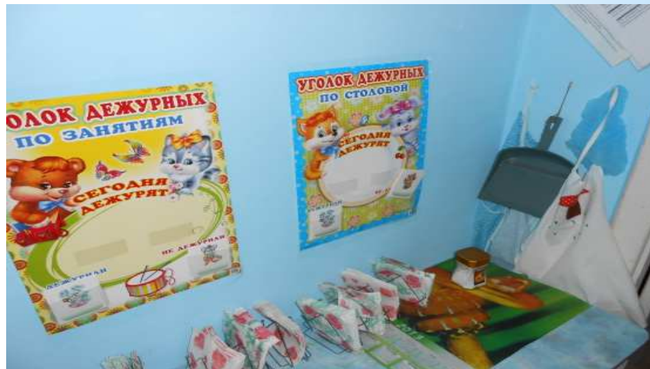
центр трудового воспитания