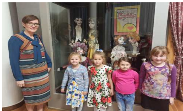
посещение театра кукол