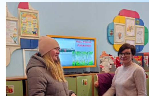
советы по воспитанию детей