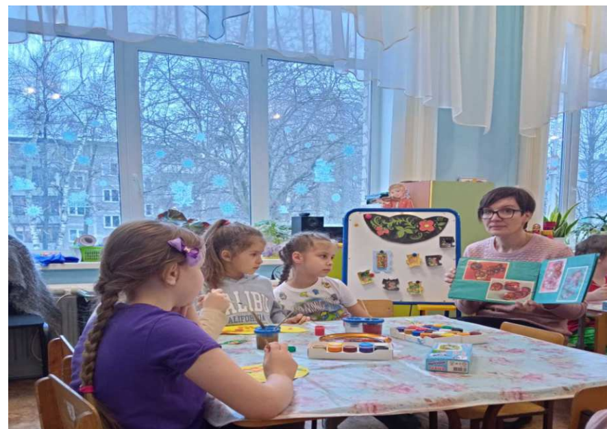
декоративное рисование по мотивам Хохломы