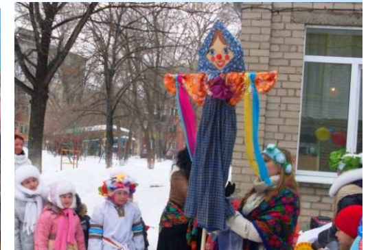
сжигание чучела Зимы