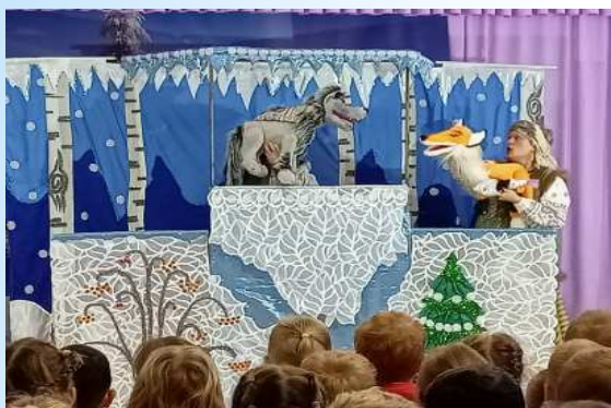
просмотр сказки «Лиса и Волк»