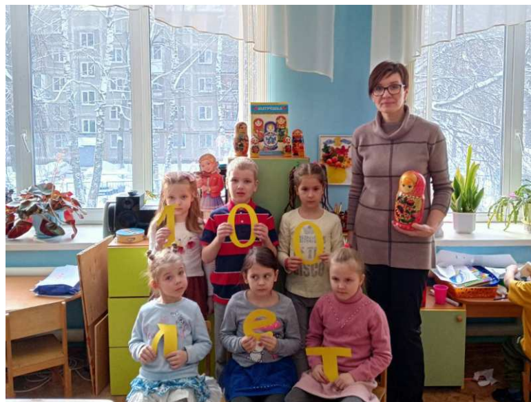
К 100-летию юбилею Семёновской матрёшки