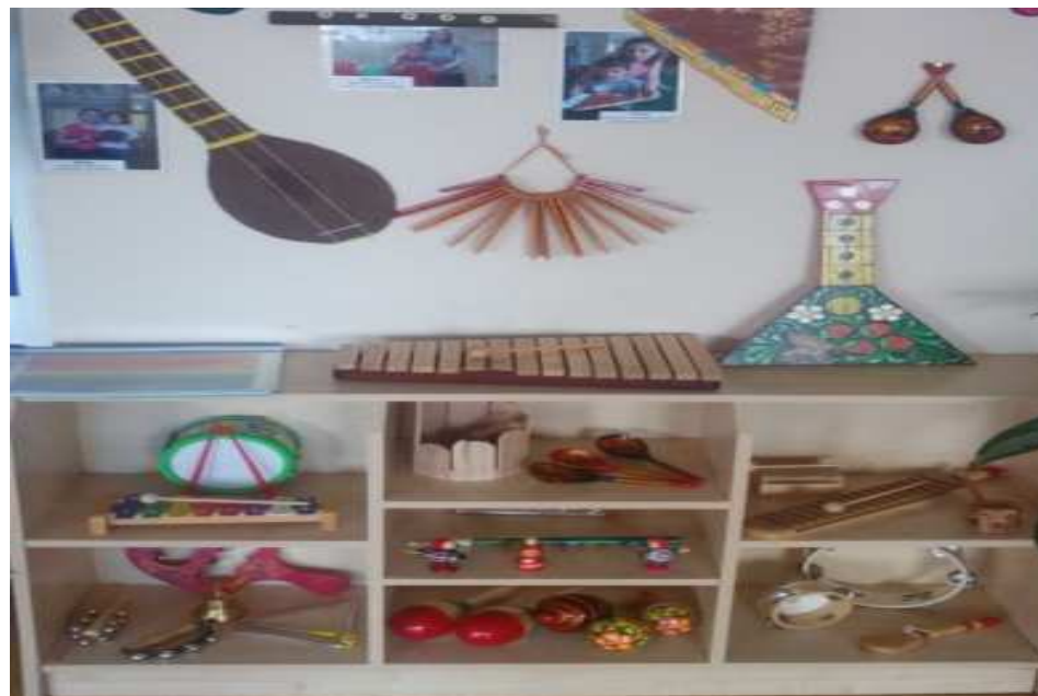
центр музыкального воспитания