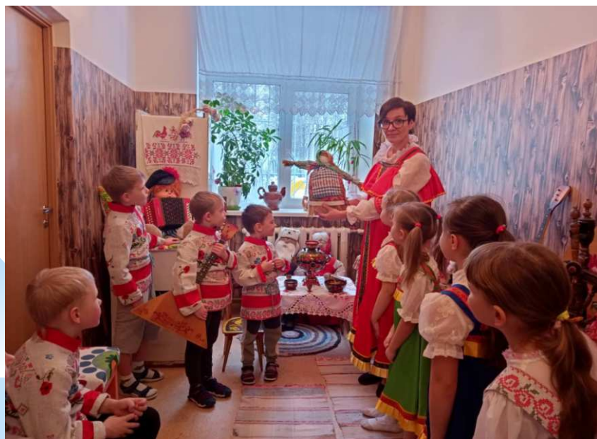
беседа о народной кукле