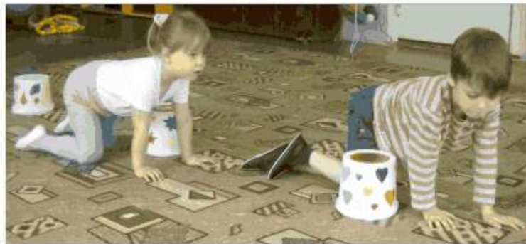
Ползание на четвереньках змейкой

Цель использования: развитие устойчивости во время движений и в статическом положении, координации движений.