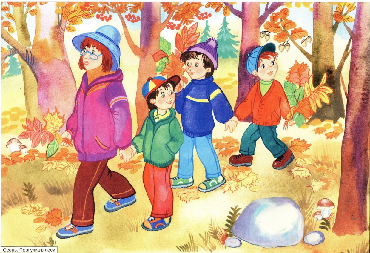
Осень. Прогулка в лесу