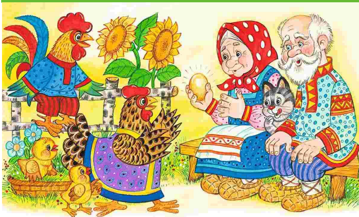
Снесла курочка яичко – не простое, а золотое.