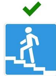
Надземный пешеходный переход