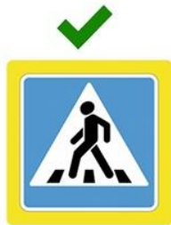
Наземный пешеходный переход

Это касается как регулируемых, так и нерегулируемых пешеходных переходов.