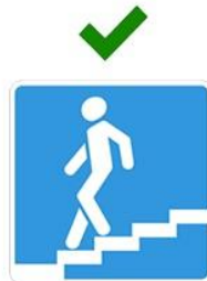
Подземный пешеходный переход