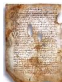
Псковская судная грамота

Двинская уставная грамота 1397 года. Мздоимство упоминается в русских летописях XIV века, например в Двинской уставной грамоте 1397 года в статье 6: «А самосуда четыре рубли, а самосуд то: кто изыснав татя с поличным, да отпустит, а себе посул возьмет, а наместники доведаются по заповеди, ино то самосуд, а опричь того самосуда нет». Там же, в статье 8: «...а черес поруку не ковати, а посула в железех не просити; а что в железех посул, то не в посул».