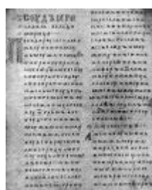
Двинская уставная грамота

Лихоимец – жадный вымогатель, взяточник».