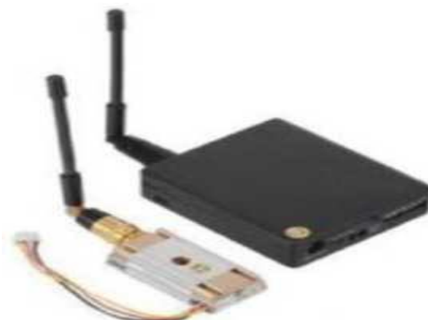
Рис. № 10 - Видеопередатчик.

Видеопередатчик (рис. № 10) - это устройство, передающее на наземную станцию изображение с камер БПЛА. Является самым заметным устройством на борту БПЛА, поэтому без необходимости включать его не стоит (это касается только тех БПЛА, которые хранят фотографии на борту), соблюдая режим радиомолчания. Такой режим уменьшает возможность применения противником средств РЭБ.