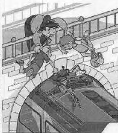
Проезд на крышах и подножках вагона опасен и может стоить жизни!