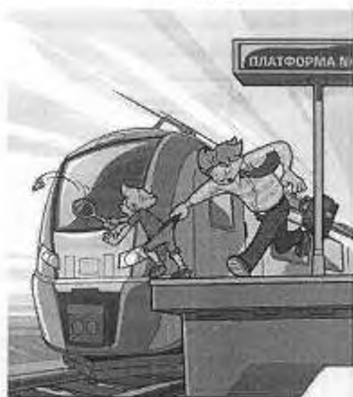
Железная дорога – не место для игр!