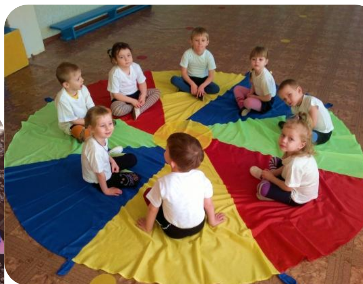
Тактильная дорожка или «Парашют» (используется для подгрупповой игры)