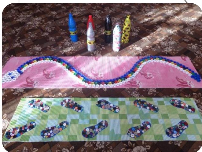
Различные массажные дорожки