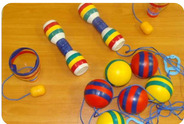
Самодельные гантели и оборудование для развития координации рук и глазомера

Я предлагаю несколько примеров нестандартного физкультурного оборудования, которые легко можно изготовить своими руками и использовать его для проведения подвижных игр в группе и на прогулке, различных игровых упражнений и занятий на свежем воздухе.