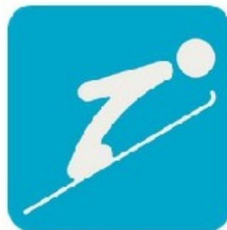
Прыжки с трамплина