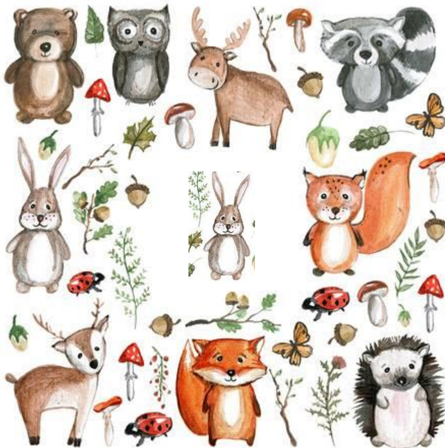
Сравнение зайчиков разной величины. (Большой-маленький)

- Назови части игрушки. ( Носик, хвост, лапки, живот, спинка ). Где у зайки носик? Взрослый показывает картинки «Здесь, на картинках, тоже есть зайки, но они спрятались среди других игрушек, найдите их»