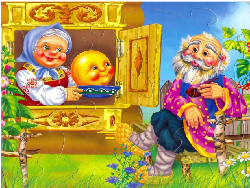
Иллюстрация к сказке «Колобок». Посмотрите, дом стоит. А кто на окошке сидит? Из муки он был печен, На сметане был мешен. На окошке он студился, По дорожке он катился. Был он весел, был он смел И в пути он песню пел. Кто это? Как же называется сказка? «Колобок». Кто живет в домике? Колобок, дед с бабой. Кто слепил колобка? Баба. Какой колобок? Румяный, круглый.

Стал дед тянуть репку, тянет — потянет, вытянуть? — не может! И позвал дед... кого? Кто помогал деду тянуть репку? И так далее по очереди: внучка, жучка, кошка, мышка. Тянут — потянут и вытянули репку А сейчас мы пойдем в гости к сказке, а как она называется, ты мне сам(а) скажи.