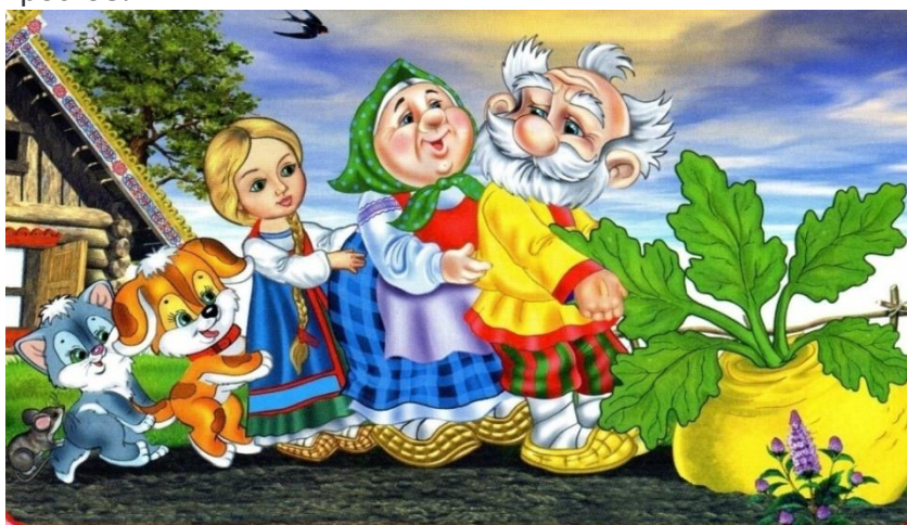
Иллюстрация к сказке «Репка». Вот мы с тобой и попали во вторую сказку. В какую сказку мы попали? (Взрослый открывает иллюстрацию.)

Мышка. Правильно. Мышка бежала, хвостиком махнула, яичко упало и разбилось. Дед с бабой плачут. А курочка Ряба им говорит: «Дед, баба не плачьте, я снесу вам новое яичко, не золотое, а простое!»