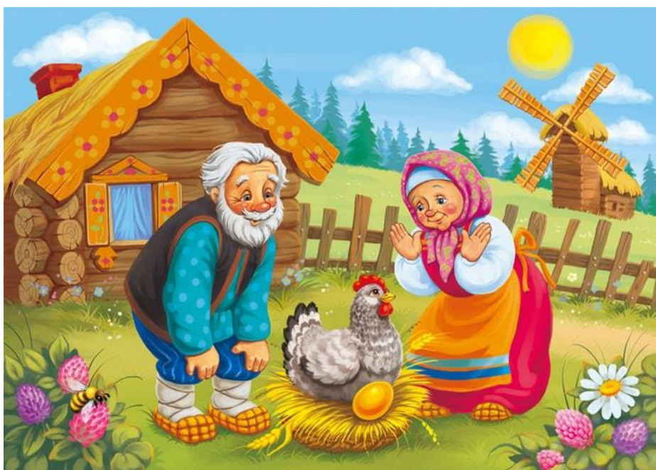
Иллюстрация к сказке «Курочка Ряба».

Вот мы и попали в первую сказку. В какую сказку мы попали? (Взрослый открывает иллюстрацию.)