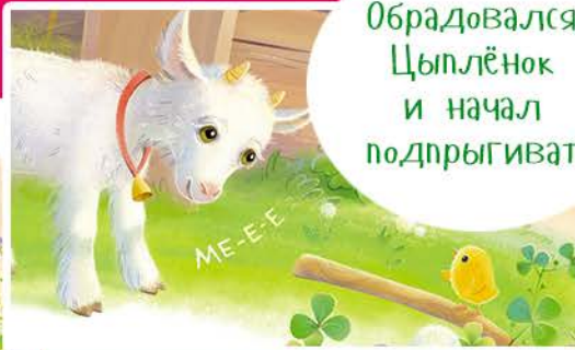
Встреча с Козлёнком

Обрадовался Цыплёнок и начал подпрыгивать