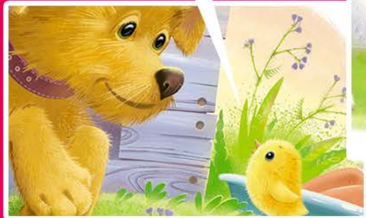
Встреча с псом Шариком

Обрадовался Цыплёнок и начал подпрыгивать