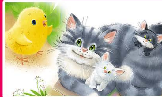
Встреча с Кошкой и котятами