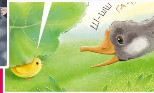
Встреча с Гусыней