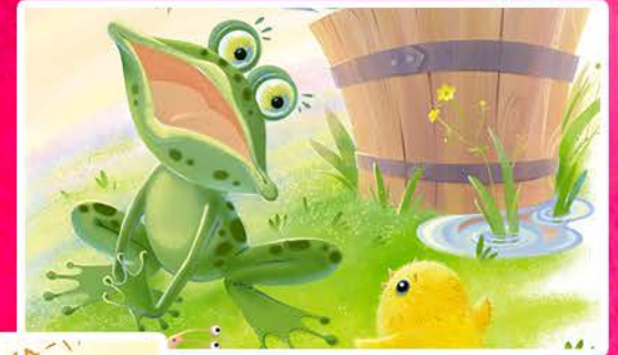
Встреча с Лягушкой