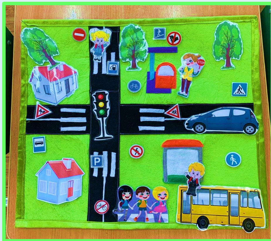
Панно «Путешествие по городу»