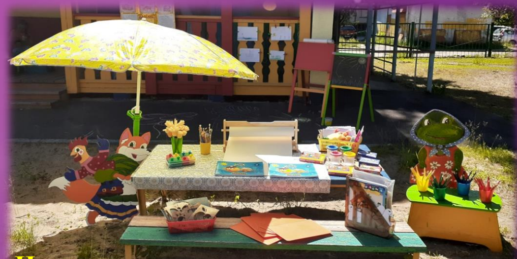
Центр самостоятельного художественного творчества