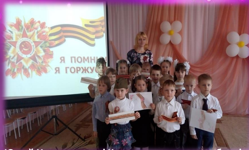
Юный Нижегородец! Края родного достоин будь!»