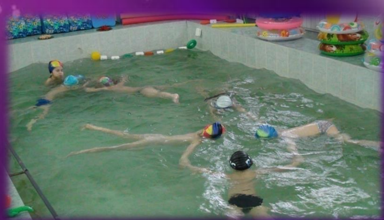
Игры на воде («Морская звезда»)