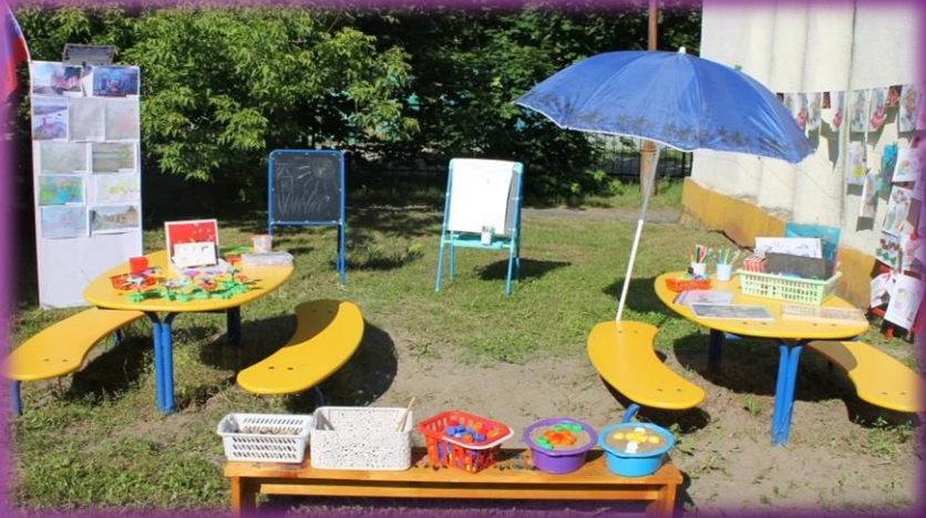
Центр самостоятельного художественного творчества