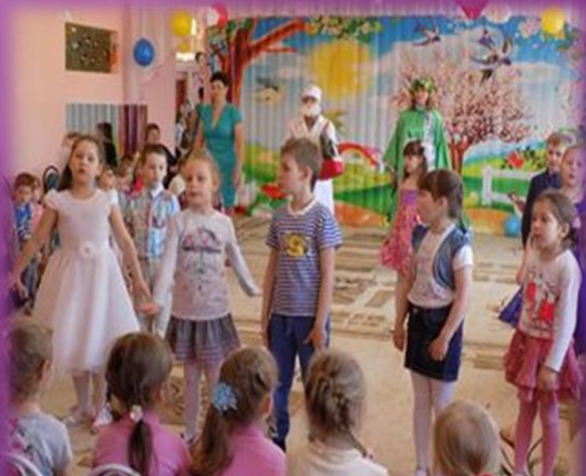
Выступление вокальных групп на праздниках («Весёлые нотки»)

-- «Забава» - лепка из солёного теста (для детей 3-4, 4-5 лет)