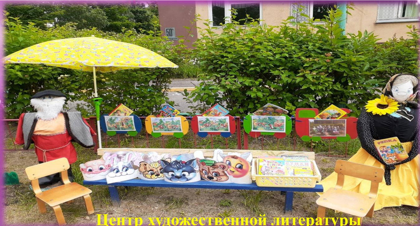
Центр художественной литературы