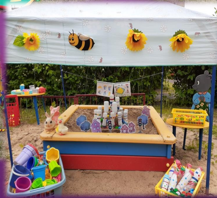
Центр игр с песком