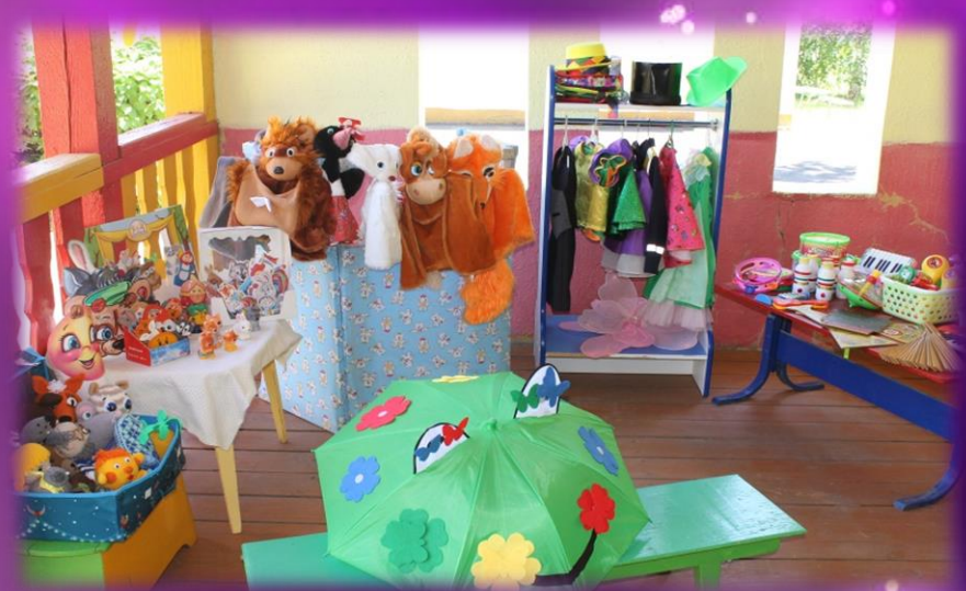
Центр театрализованной деятельности