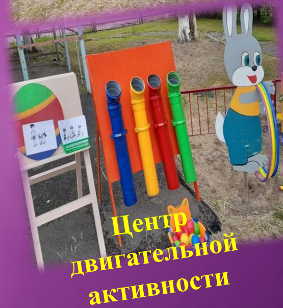
Центр двигательной активности