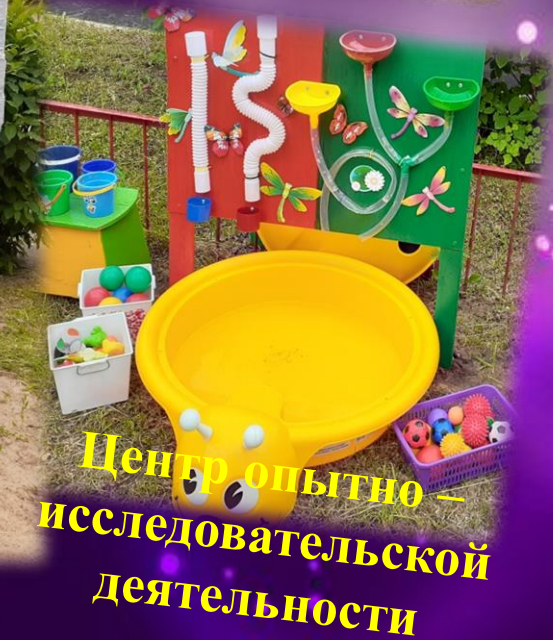
Центр опытно- исследовательской деятельности