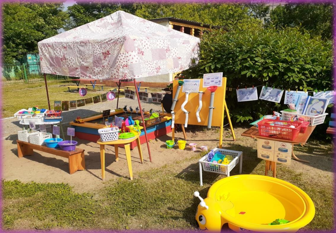
Центр опытно-исследовательской деятельности