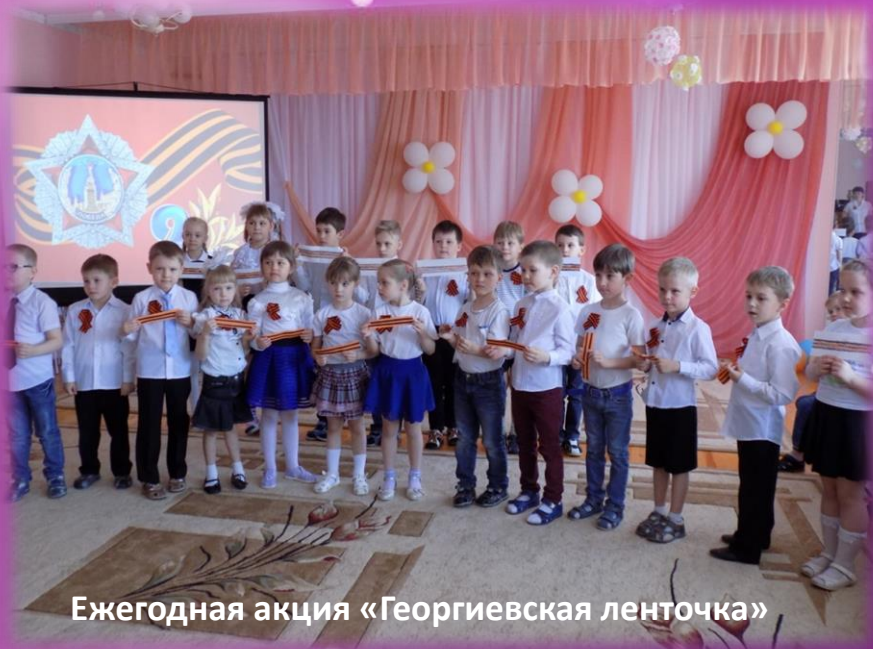
Ежегодная акция «Георгиевская ленточка»