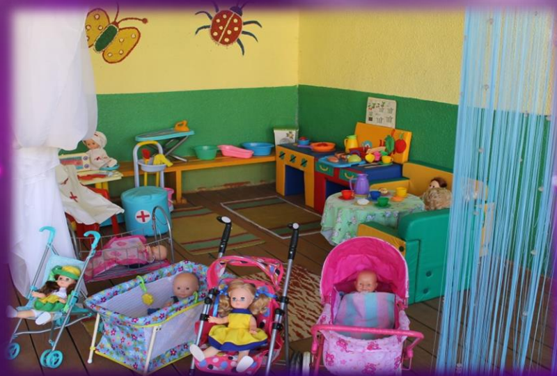
Центр сюжетно-ролевой игры