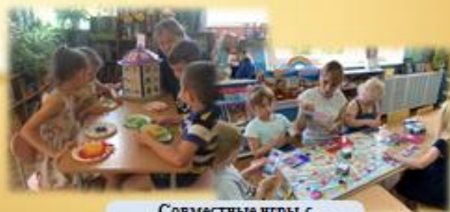
Совместные игры с использованием дидактических пособий