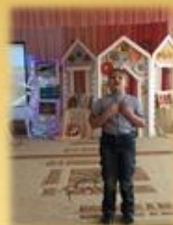
Поэтический марафон «Ниžний Новгород на Волге – город мой родной»