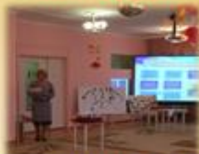
«Лаборатория инновационной деятельности»