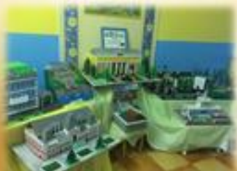
Мини-музей «Есть над Волгой и Окой добрый славный город мой»