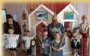
Историческая квест-игра «Защитники Кремля Нижегородского»