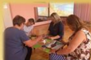
Творческая мастерская «Бюджет»