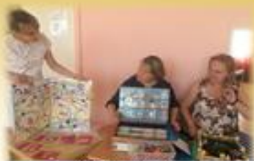
Смотр-конкурс дидактических игр «Мой любимый Нижний Новгород»