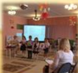
Презентация проектной деятельности на педагогическом совете