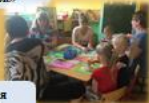
Семейная гостиная «Город мастеров»