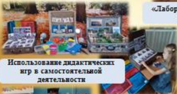
Использование дидактических игр в самостоятельной деятельности