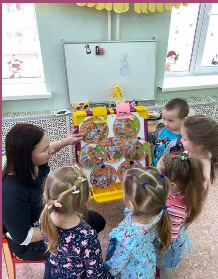
Знакомство с масленицей: