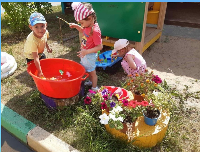
Игры с водой