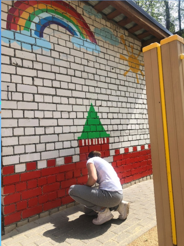
Привлечение к оформлению участка