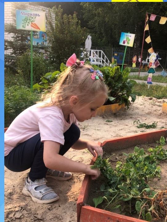
Труд на огороде