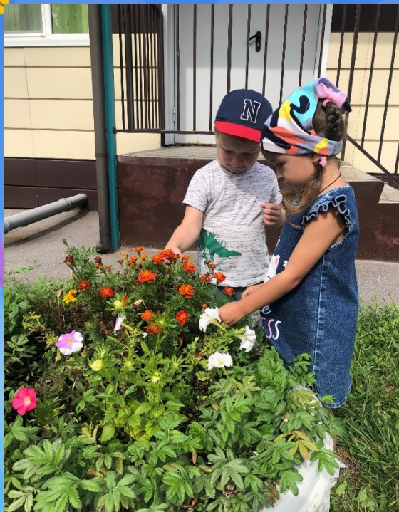
Труд в цветнике