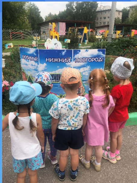
Фотовыставка «Мой город», «Мой район»