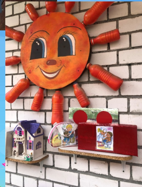
Сектор нравственно-патриотического воспитания