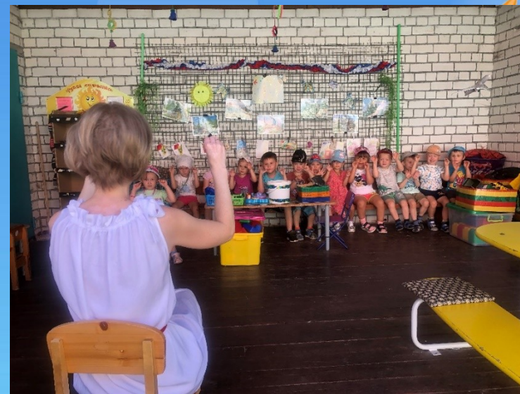
Музыкальная и танцевально-ритмическая деятельность