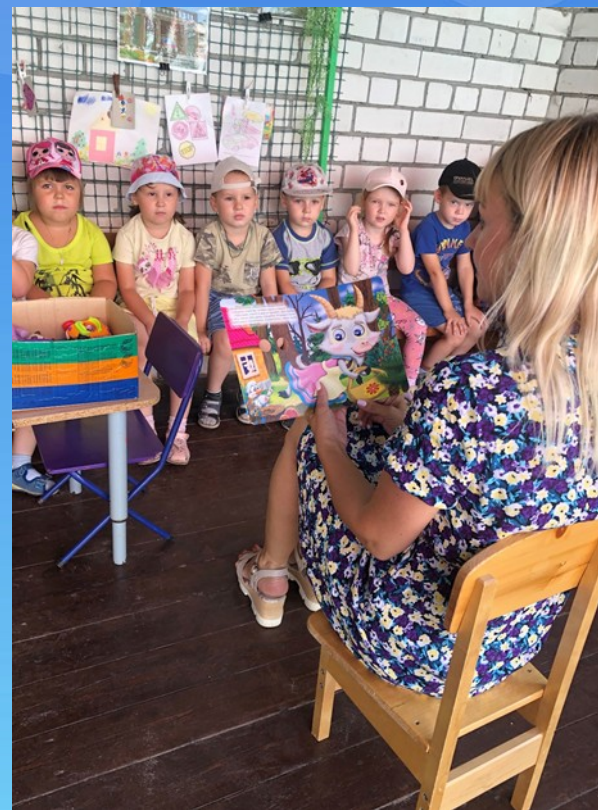
Чтение художественной литературы