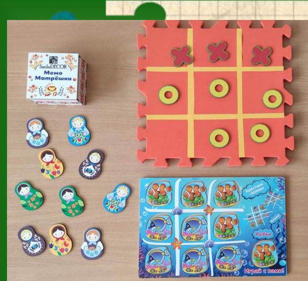
Дидактические игры: «Мемо «Матрешки», «Крестики и нолики» и др.