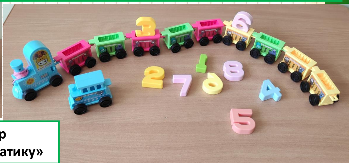
Сортер «Учу математику!»