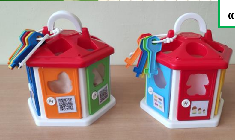
Сортер «Хочу всё знать!»