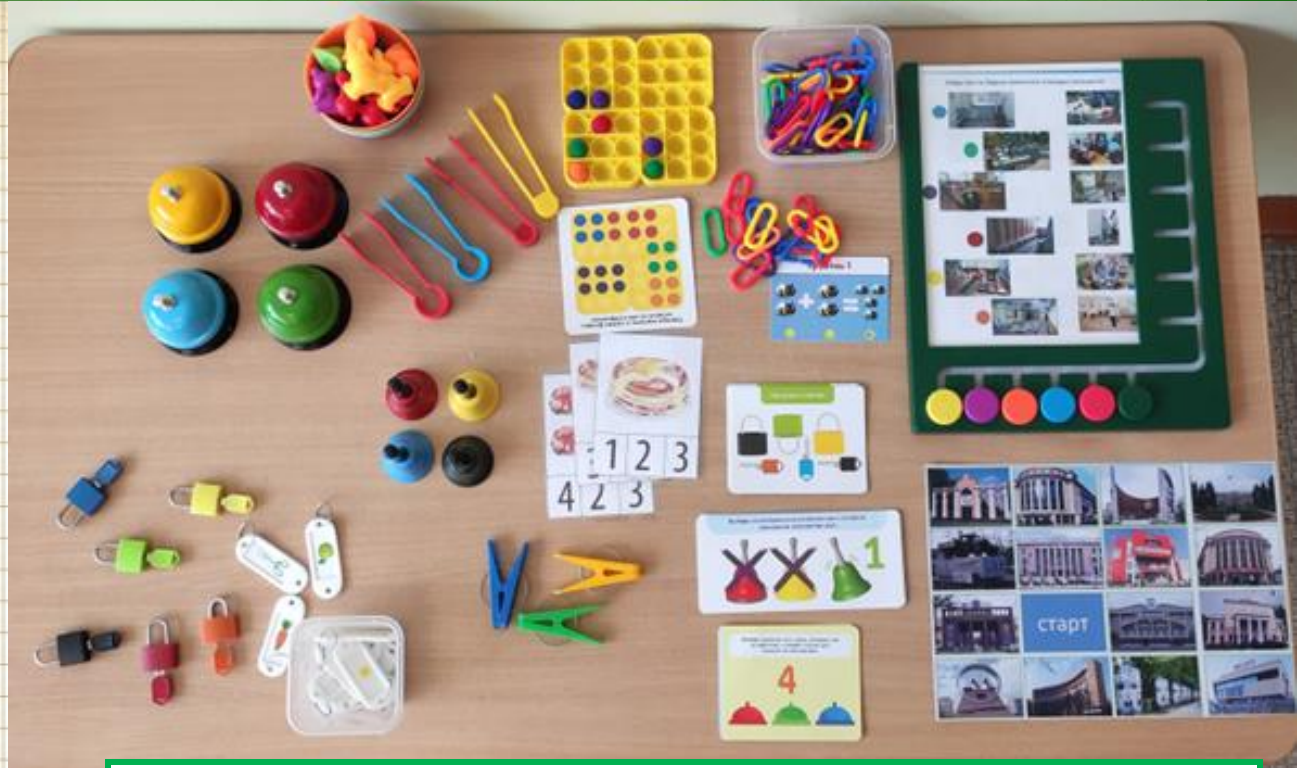
Дидактические игрушки: «Числовой поезд», «Веселые колокольчики», «Цветные замочки» и др.