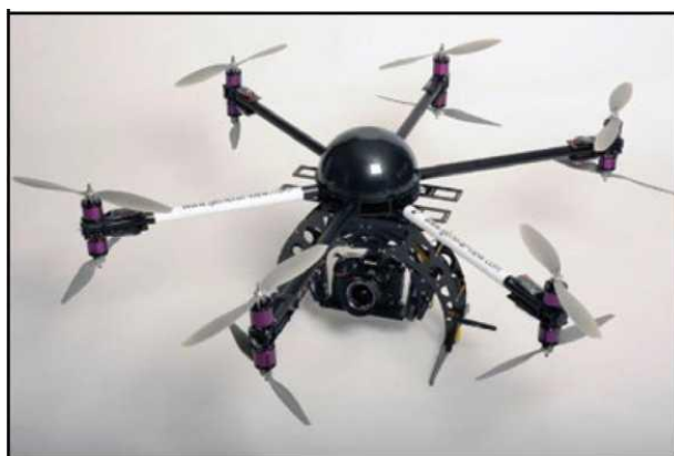
Рис. № 5 - многооторный БПЛА.

Тип БПЛА, который с каждым днем получают все большее распространение, - многооторные системы. Их еще называют мультикоптерами, квадрокоптерами, гексакоптерами, октакоптерами и тому подобное, в зависимости от количества несущих винтов. Характерная особенность - многооторная система, принцип полета - подобен вертолетному (рис. № 5).