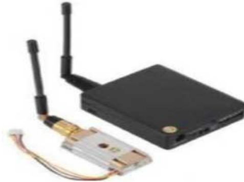
Рис. № 10 - Видеопередатчик.

Видеопередатчик (рис. № 10) - это устройство, передающее на наземную станцию изображение с камер БПЛА. Является самым заметным устройством на борту БПЛА, поэтому без необходимости включать его не стоит (это касается только тех БПЛА, которые хранят фотографии на борту), соблюдая режим радиомолчания. Такой режим уменьшает возможность применения противником средств РЭБ.