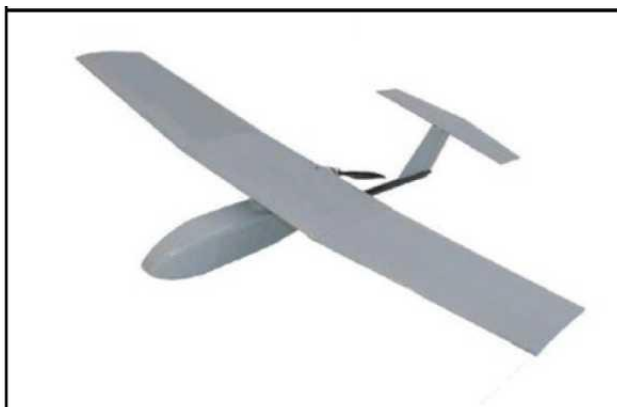
Рис. № 6 – БПЛА самолетного типа.

Существуют БПЛА, предназначенные для выполнения задач РЭР, РЭБ и связи. Скоростной диапазон работы - от 15 до 30 м/с. Рабочие высоты - в зависимости от оборудования и размеров аппарата, но всегда превышают 300 м. Обычно это диапазон высот 300 - 2000 м. Существует несколько аэродинамических схем самолетных БПЛА. Основные аэродинамические схемы – классическая (рис. № 6) и «летающее крыло» (рис. № 7).