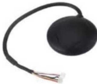
Рис. № 8 - Модуль GPS-навигации.

Рассмотрим радиопередающие системы, установленные на БПЛА.