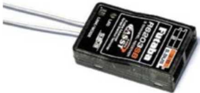
Рис. № 11 - Приемник аппаратуры управления.

Видеопередатчик (рис. № 10) - это устройство, передающее на наземную станцию изображение с камер БПЛА. Является самым заметным устройством на борту БПЛА, поэтому без необходимости включать его не стоит (это касается только тех БПЛА, которые хранят фотографии на борту), соблюдая режим радиомолчания. Такой режим уменьшает возможность применения противником средств РЭБ.