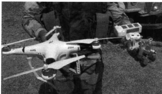
Рис. № 1 - БВС вертолетного типа.

Для совершения диверсионных актов могут использоваться БВС самолетного и вертолетного типа (рис. № 1) кустарного производства, причем доля последних значительно превышает количество самолетных. Объясняется это в первую очередь их более низкой стоимостью.