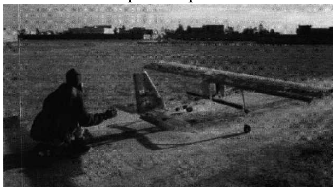
Рис. № 4 - малогабаритный летательный аппарат.

БВС-камикадзе является весьма специфичным классом беспилотной техники, информация о котором чаще всего носит секретный характер. Такой дрон представляет собой малогабаритный летательный аппарат (рис. № 4), способный нести несколько килограмм взрывчатки.