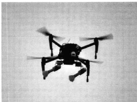
Рис. № 3 – квадрокоптер.

используют отрезок пластиковой трубы, в которой с помощью лески закрепляется граната.