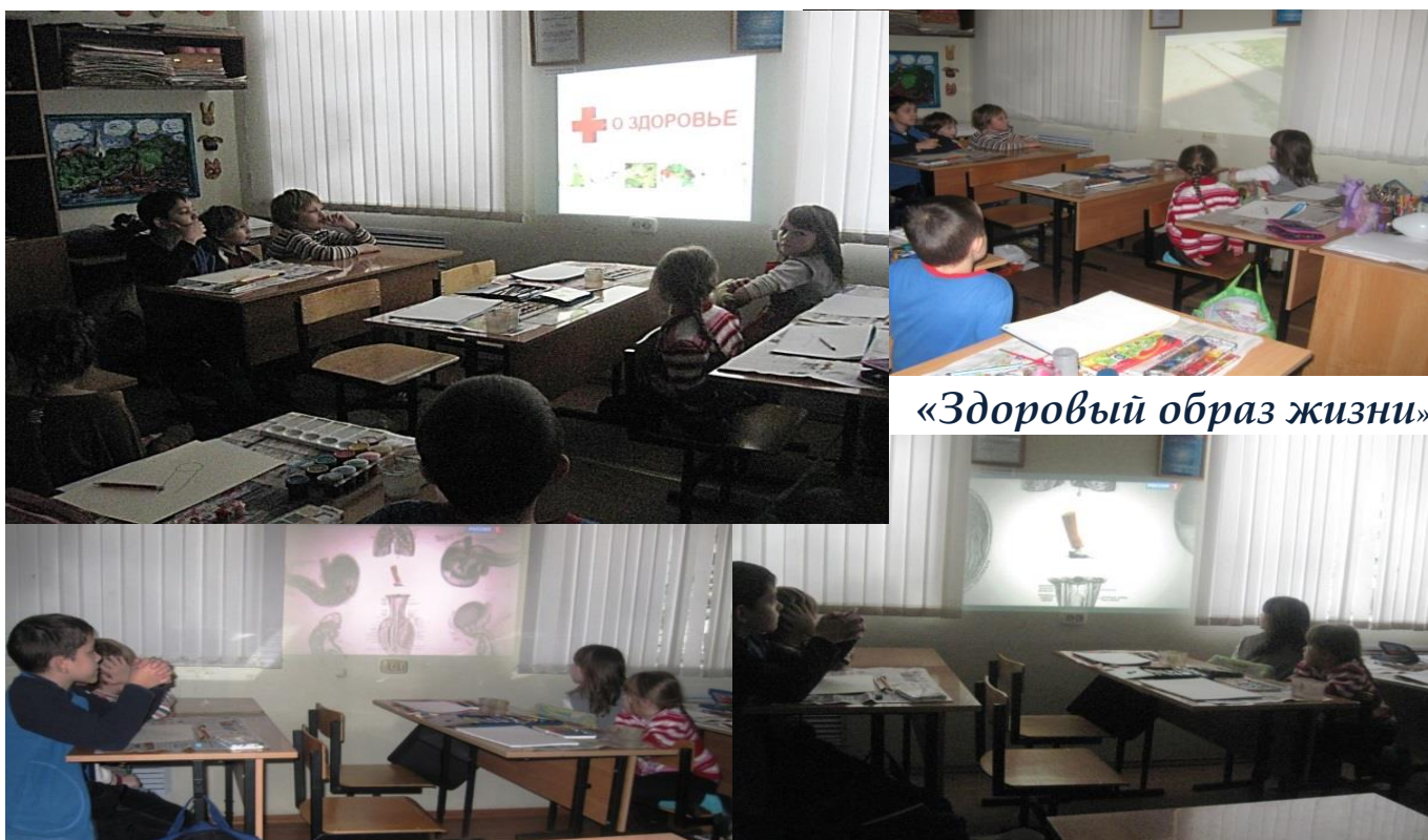
«Здоровый образ жизни»