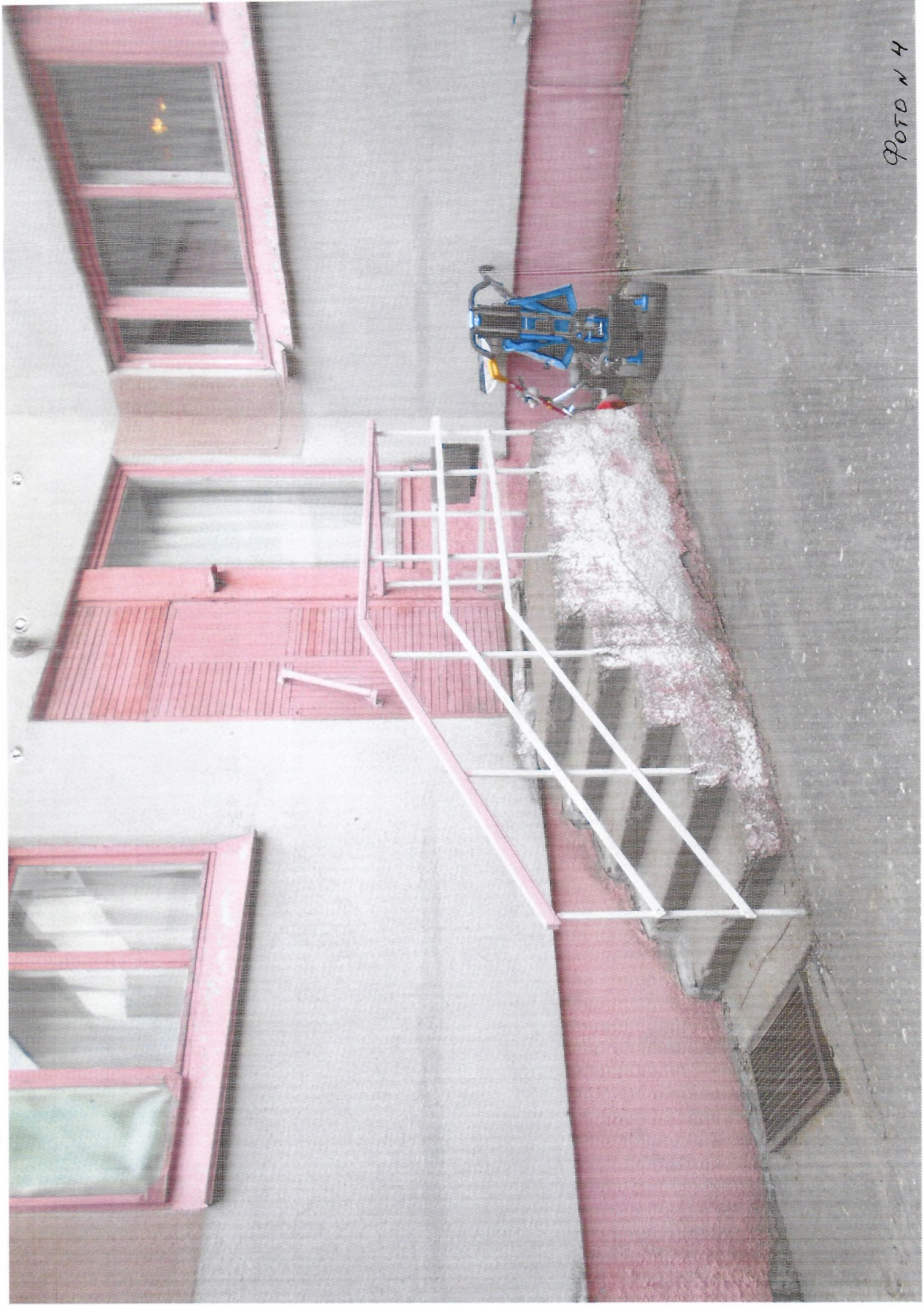
ФОТО N 4