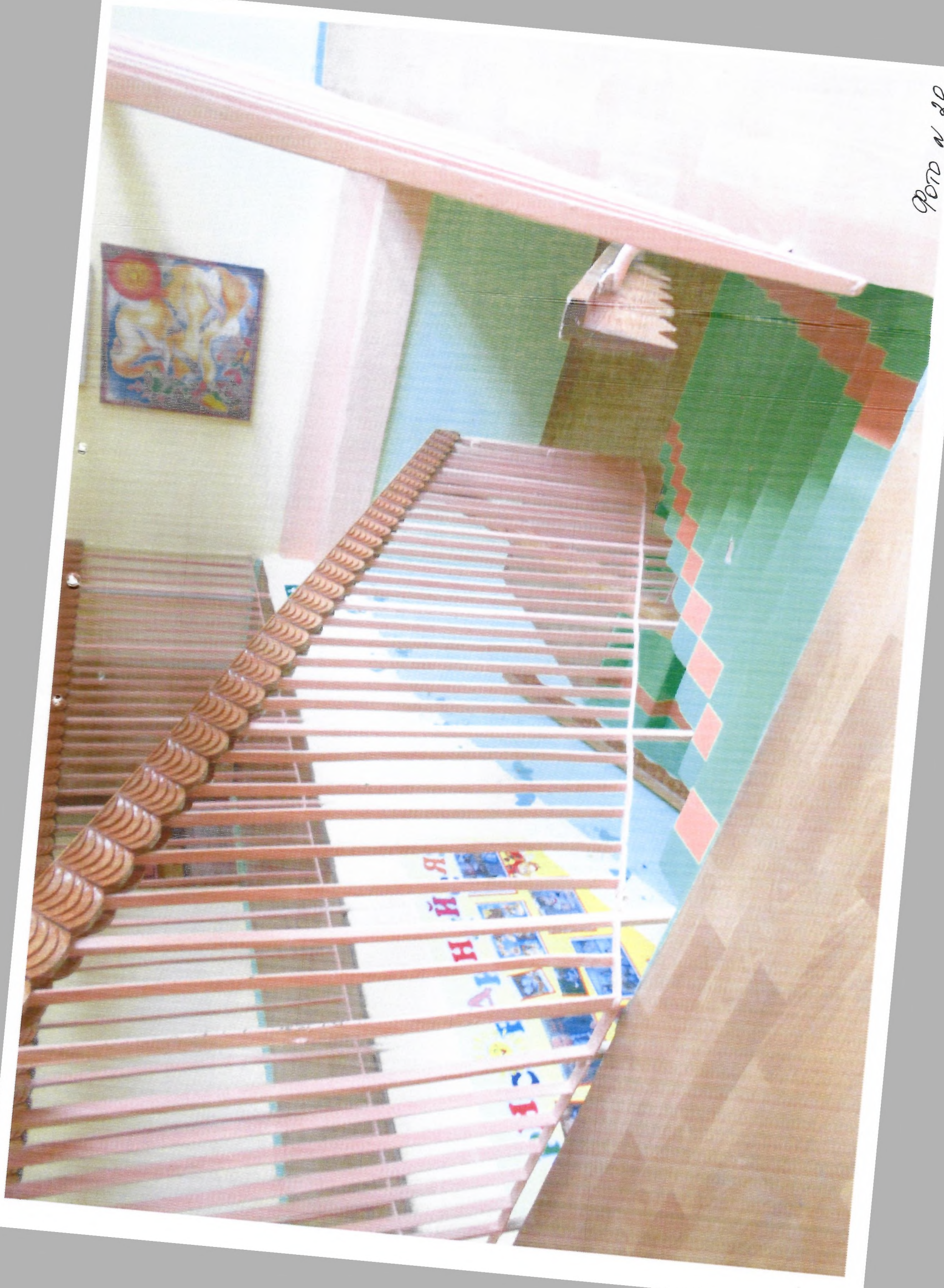
ФОТО N 20