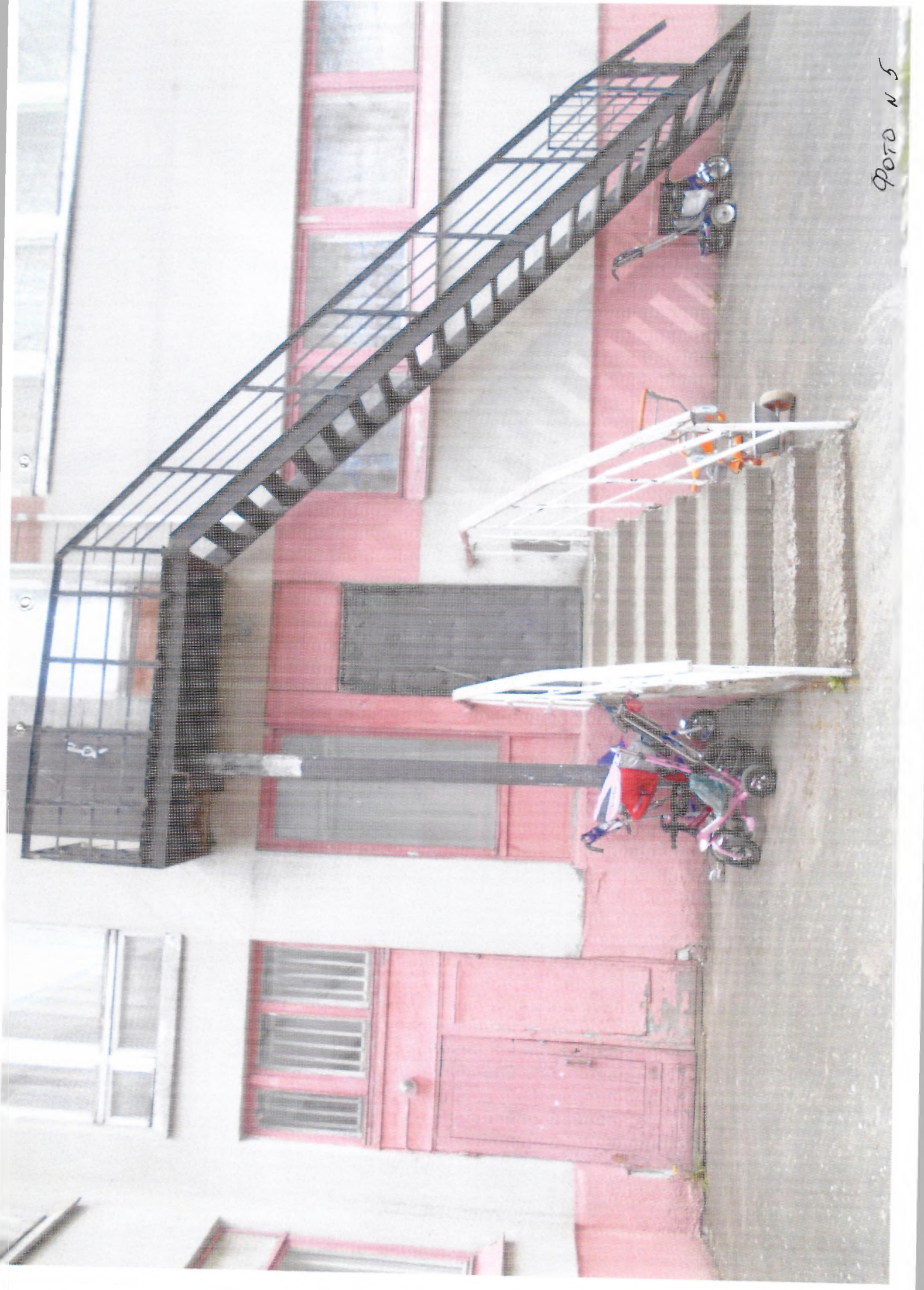
фото n 5