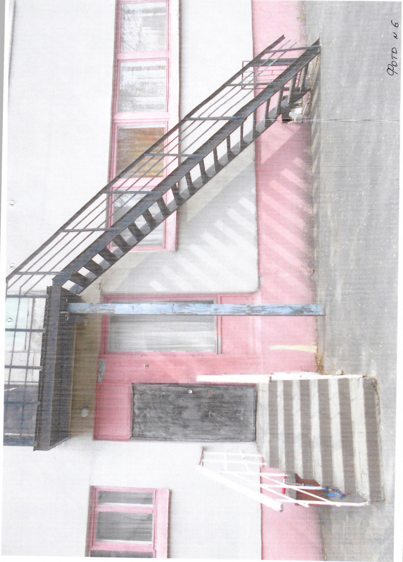
фото № 6