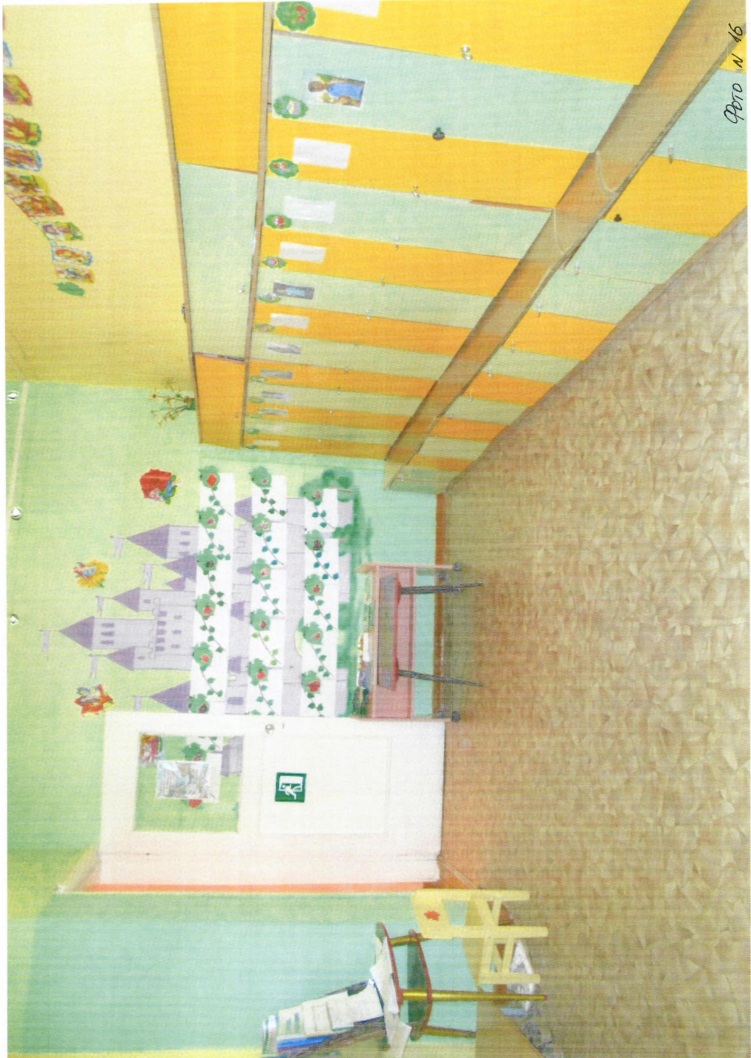
ФОТО N 46