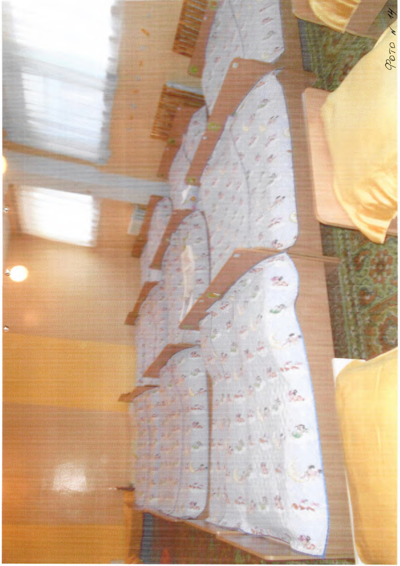
ФОТО № 14