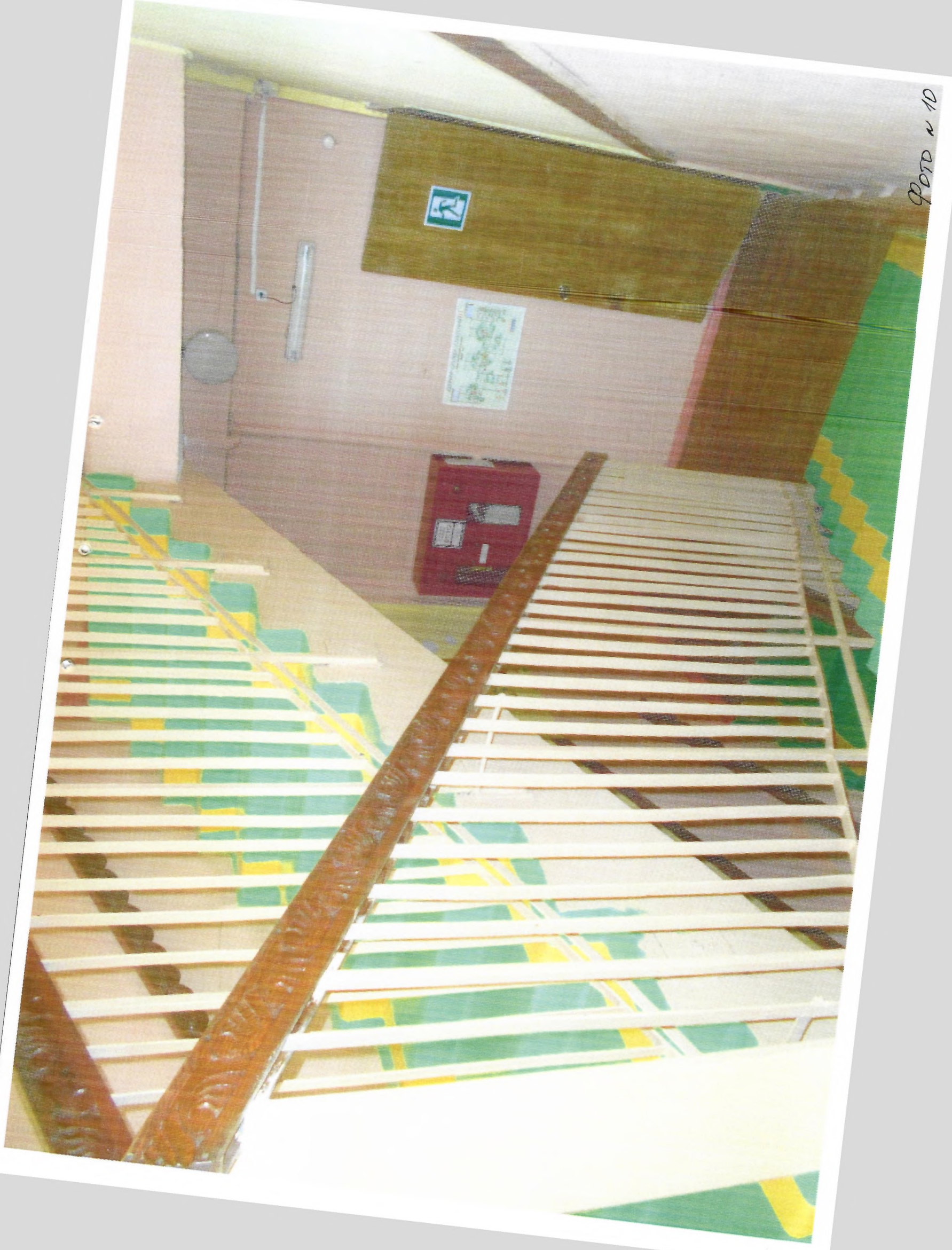
ФОТО № 10