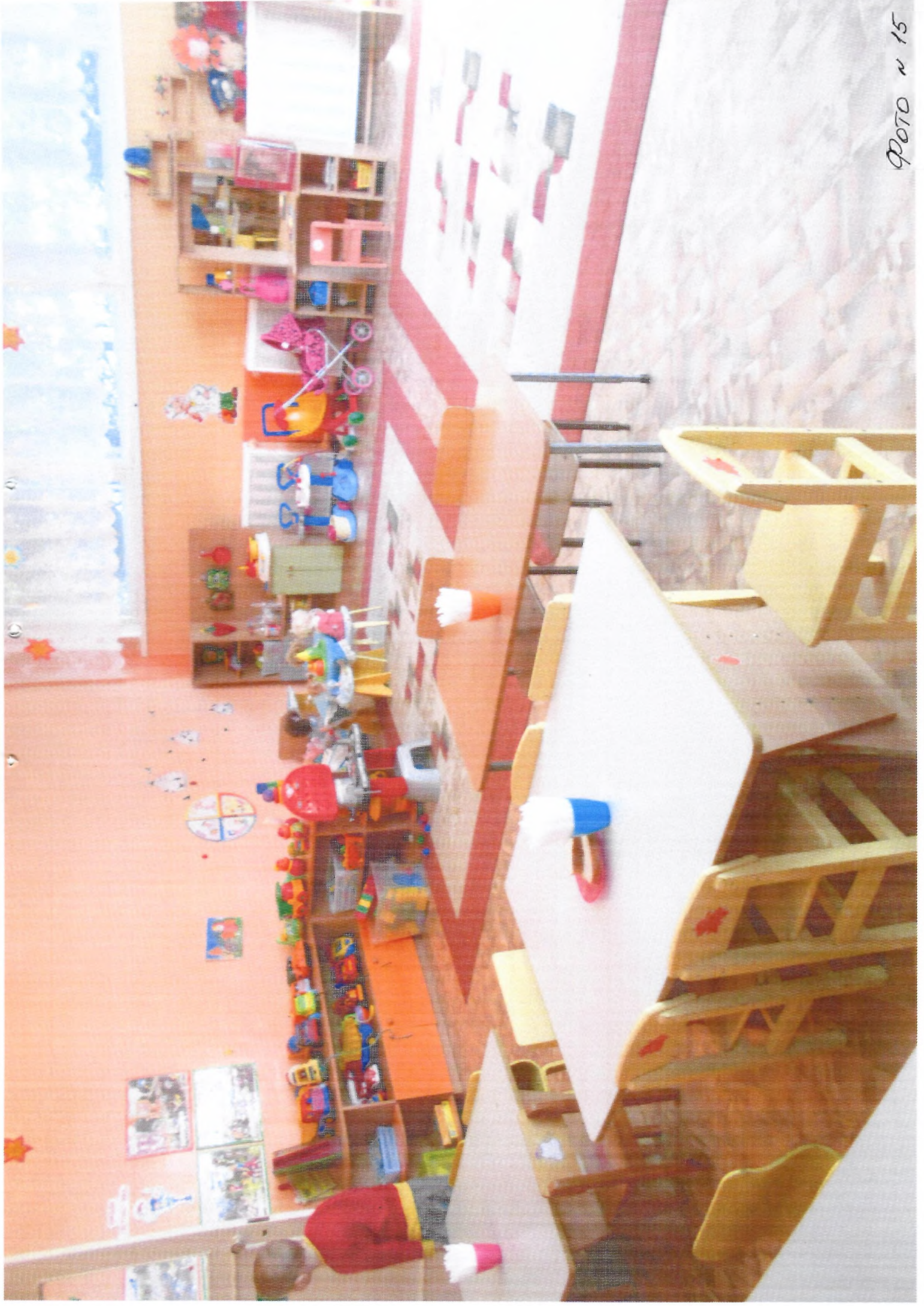
ФОТО № 15