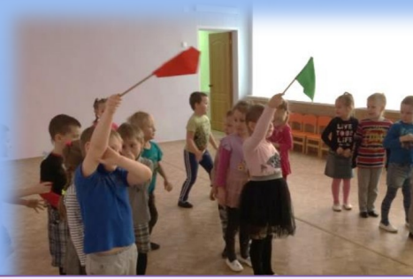
Подвижная игра «Красный, желтый, зеленый»