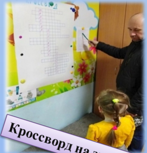
Кроссворд на знание ПДД