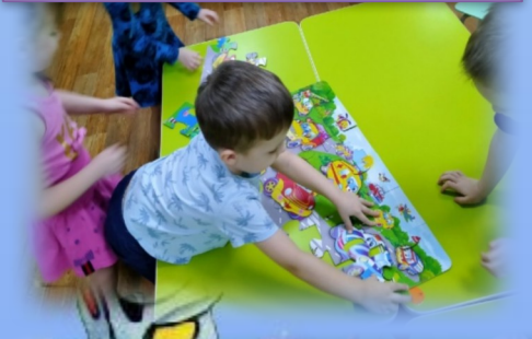
Ди «Собери автомобиль»