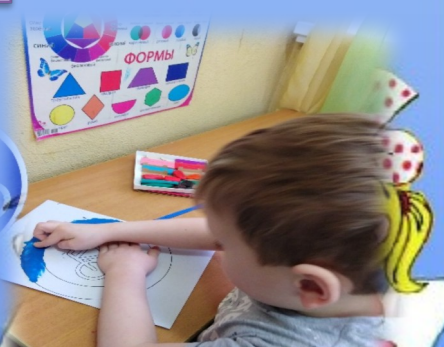
Пластилинография «Мой знак»