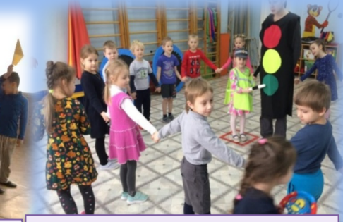
Подвижная игра «Запомни сигнал регулирующего»