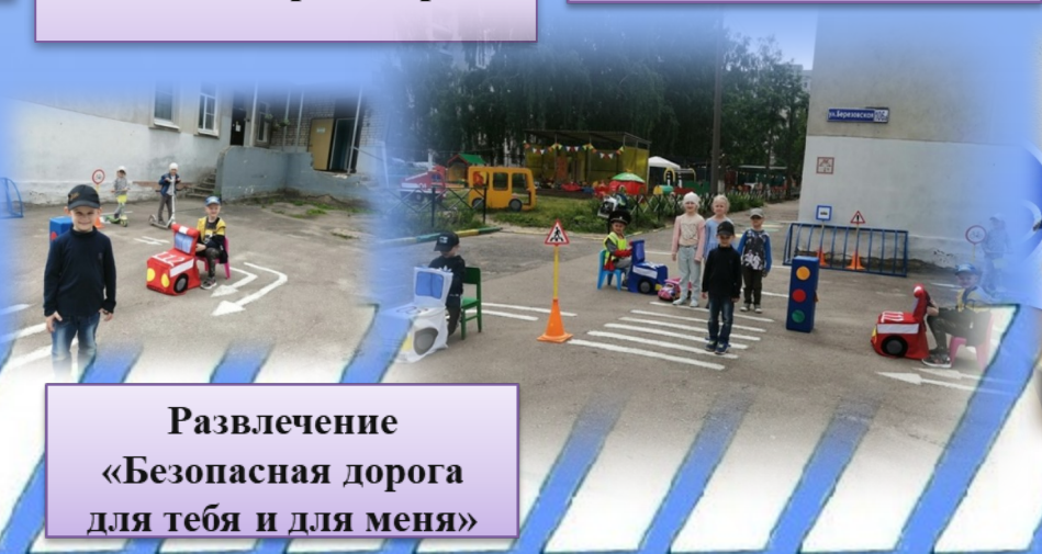
Развлечение «Безопасная дорога для тебя и для меня»