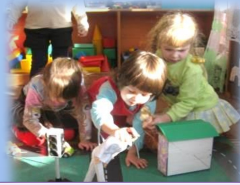
«Отведи куколку в детский сад»