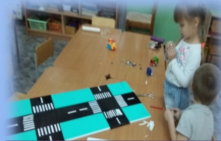
Создание макета проезжей части