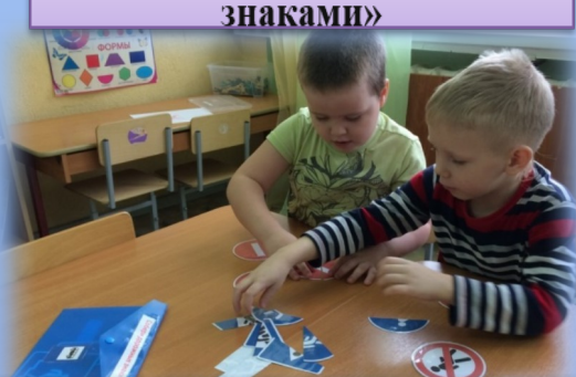
Д/и «Собери знак»