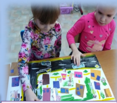
Аппликация «Моя улица»