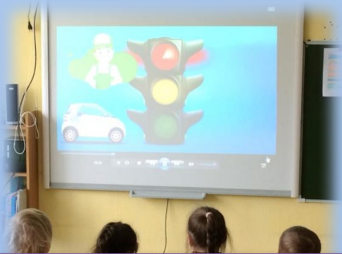
Обучающие мультфильмы «Светофор»