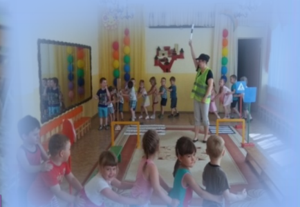
Игра-эстафета «Дойди до знака»