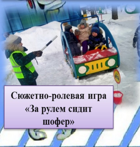
Сюжетно-ролевая игра «За рулем сидит шофер»