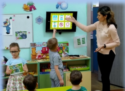
Беседа «Знакомство с новыми дорожными знаками»