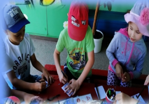
Изготовление знаков дорожного движения