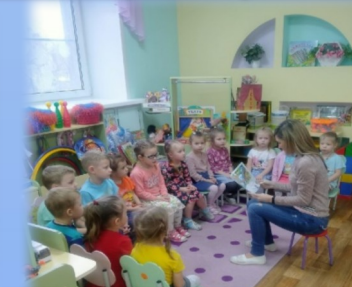
Чтение художественной литературы