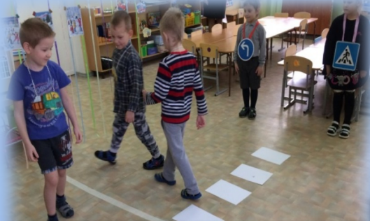
Игровая ситуация «Части дороги»