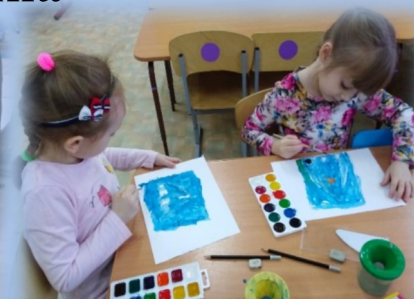
Рисование «Нарисуй знак, который запомнил»