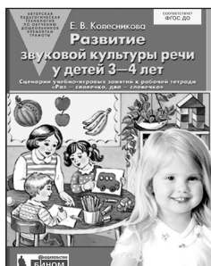
«Развитие звуковой культуры речи у детей 3–4 лет». Учебно-методическое пособие