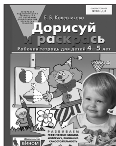
«Дорисуй и раскрась». Рабочая тетрадь для детей 4–5 лет