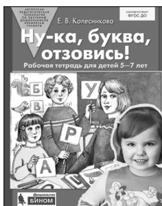
«Ну-ка, буква, отзовись!» Рабочая тетрадь для детей 5–7 лет