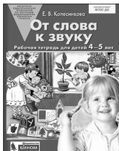
«От слова к звуку». Рабочая тетрадь для детей 4–5 лет