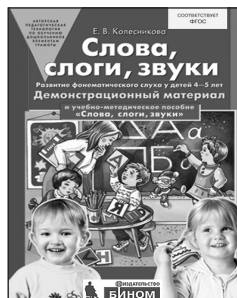
«Слова, слоги, звуки». Демонстрационный материал для занятий с детьми 4–5 лет