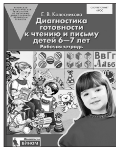
«Диагностика готовности к чтению и письму детей 6–7 лет». Рабочая тетрадь