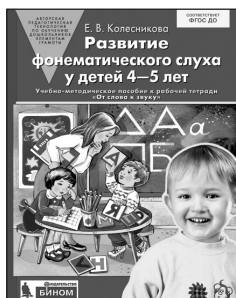
«Развитие фонематического слуха у детей 4–5 лет». Учебно-методическое пособие