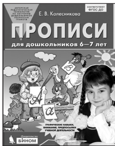
«Прописи для дошкольников 6–7 лет»