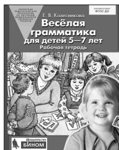
«Веселая грамматика для детей 5–7 лет». Рабочая тетрадь