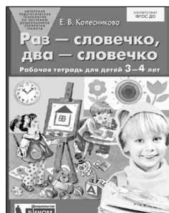
«Раз – словечко, два – словечко». Рабочая тетрадь для детей 3–4 лет