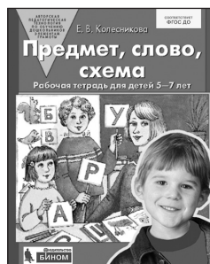
«Предмет, слово, схема». Рабочая тетрадь для детей 5–7 лет