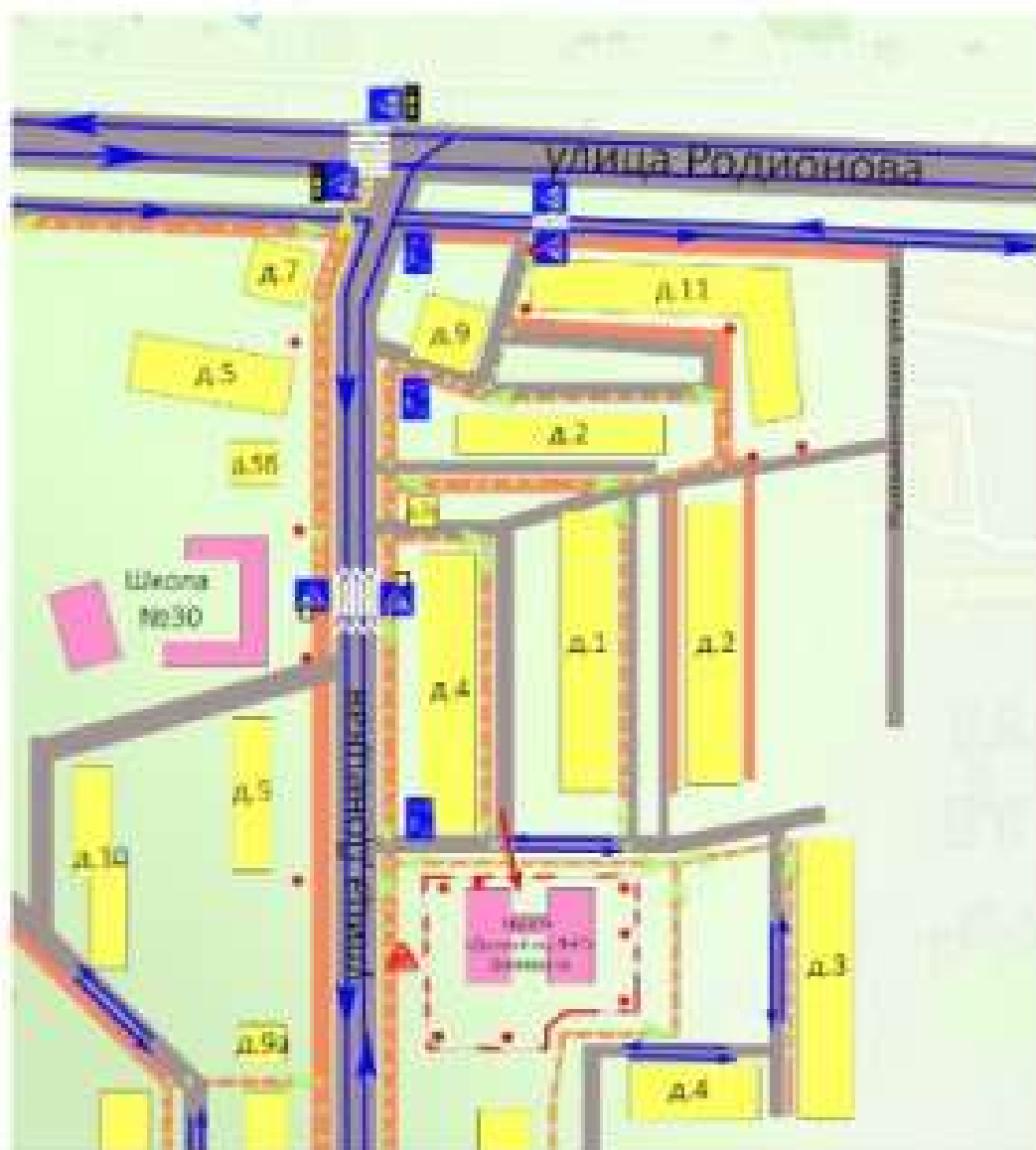
Схема организации дорожного движения в непосредственной близости от образовательного учреждения с размещением соответствующих технических средств, маршруты движения детей