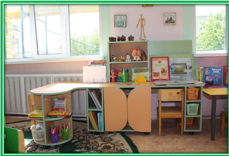
«Центр художественно – эстетического развития»