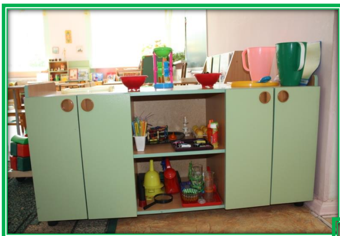
«Лаборатория», или «Центр экспериментирования»