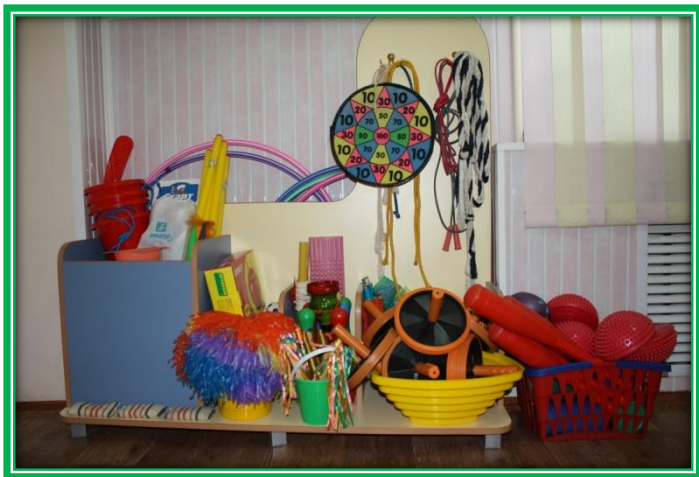
«Центр физического развития»