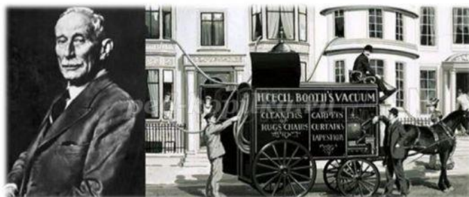
Хьюберт Сесил Бут