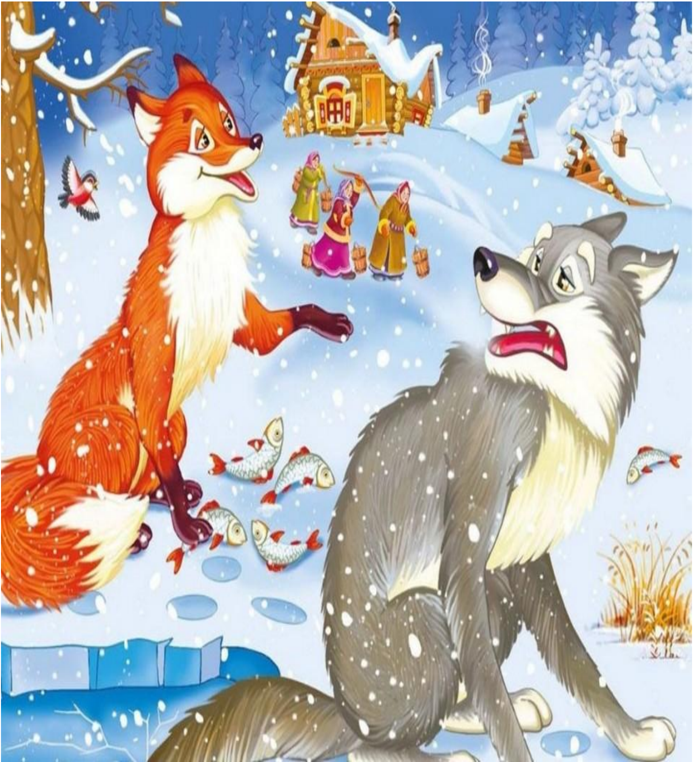
«Лисичка со скалочкой»