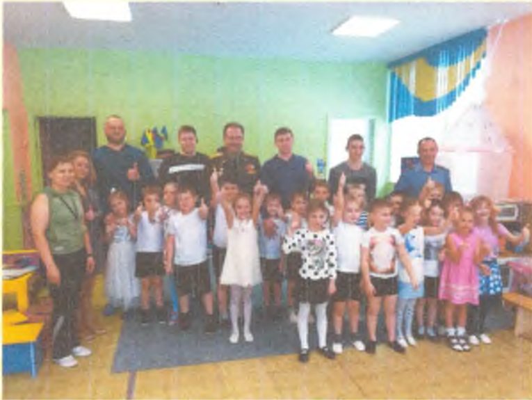
Мастер-класс с папами группы №4 «Солнечный город» к 23 февраля 22.02.2021г