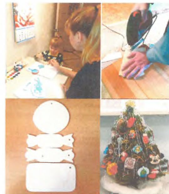
Творческая мастерская «Новогодняя игрушка» 10.12.2021