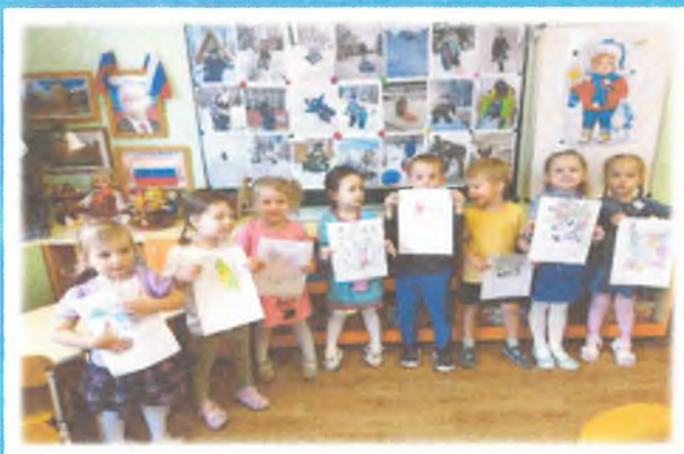
Совместная работа детей и родителей в реализации проекта «Безопасная зима- это здорово!» 24.11.2021г