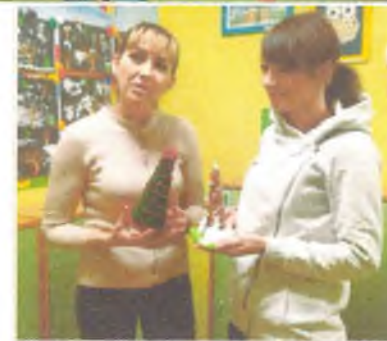
Выставка «Парод ёлочек». Защита своей ёлочки. 09.12.2020