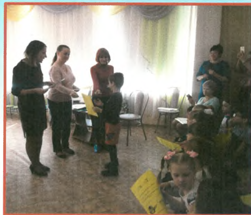
Фестиваль детско-родительских проектов «Мудрая сова» группа №4 25.02.2020