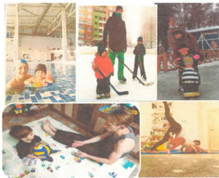
Проект «Мама, папа, я – здоровая семья». Фотоотчёт родителей на выставке 15.01.2020