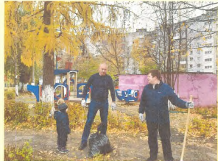
Субботник с родителями группы №4 «Солнечный город» 21.10.2021г.