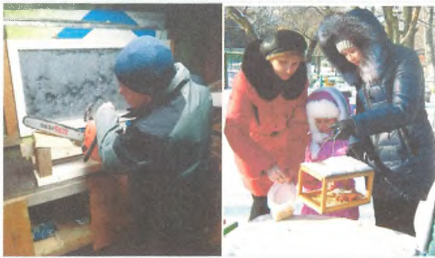
Акция «Птицам трудно зимовать-надо птицам помочь» 30.11.2019