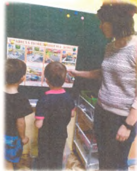
Семинар – практикум группы №6 «Почемучки» 18.11.2019 «Я и моя безопасность»