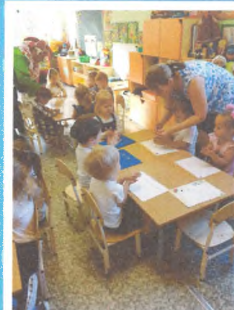
В группе «Изумрудный город» прошло открытое занятие для родителей. Мастер-класс по лепке из пластилина «Бублики» 25.10.2019 г