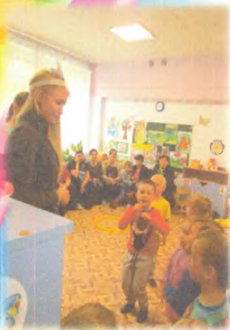
Мастер-класс родителей группы №6 «Почемучки» 28.04.2021 «По тропинкам русских народных сказок»