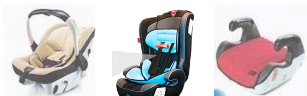
Автолюлька Автокресло Бустер