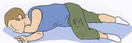
Устойчивое боковое положение