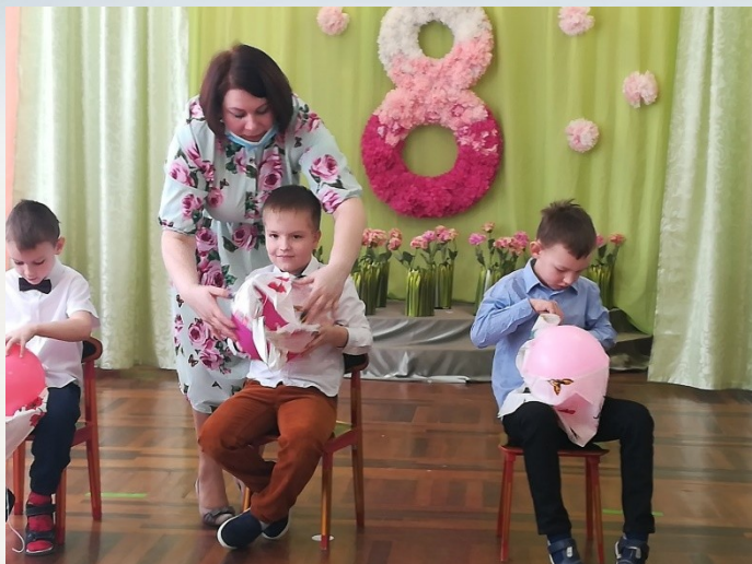
Конкурс» Повяжи платок на воздушный шарик