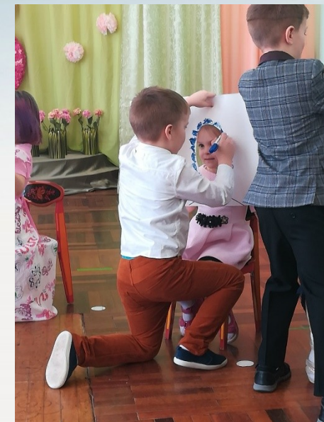
Конкурс « Мастер причесок»