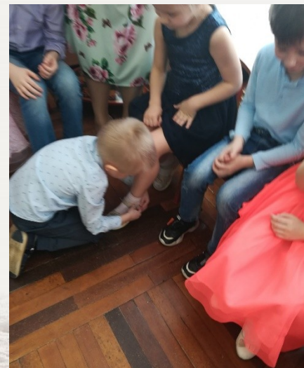
Конкурс «Тфелька для золушки»