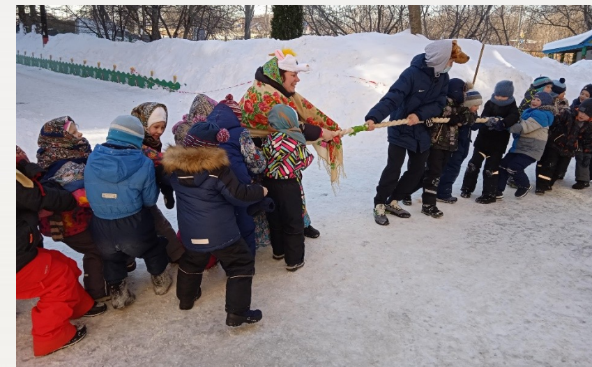
«Кто перетянет? Зима или лето!?»