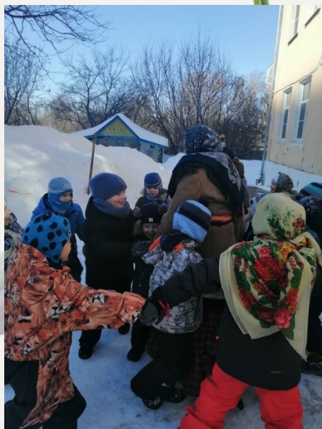
Игра «Блины горят»