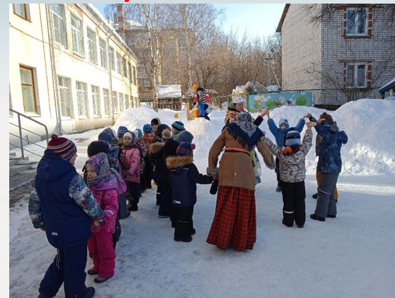
Игра «Золотые ворота»