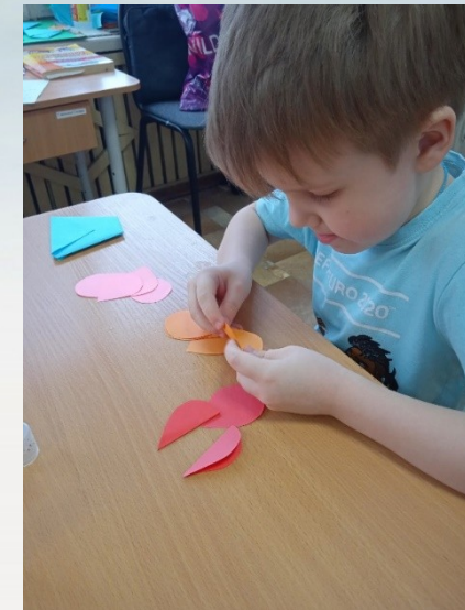
Подарок своими руками «Букет тюльпанов»