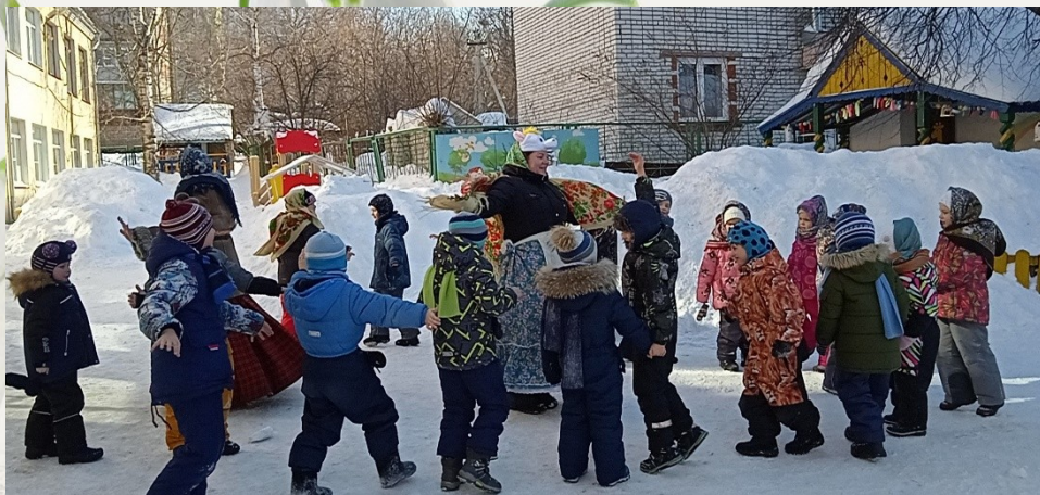
Народная игра «Покажи нам козенька», «Пошла коза по лесу»