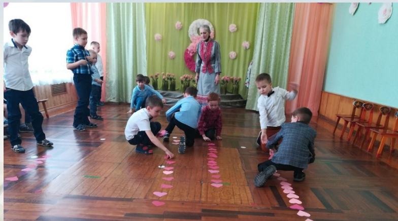
Дорожка из сердечек.. Встречаем наших девочек