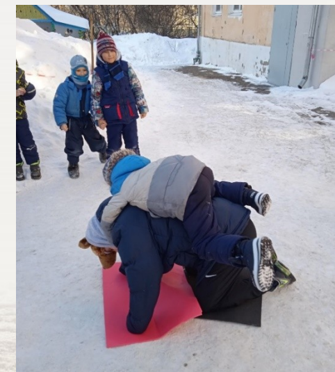
Народная забава «Оседлай медведя»