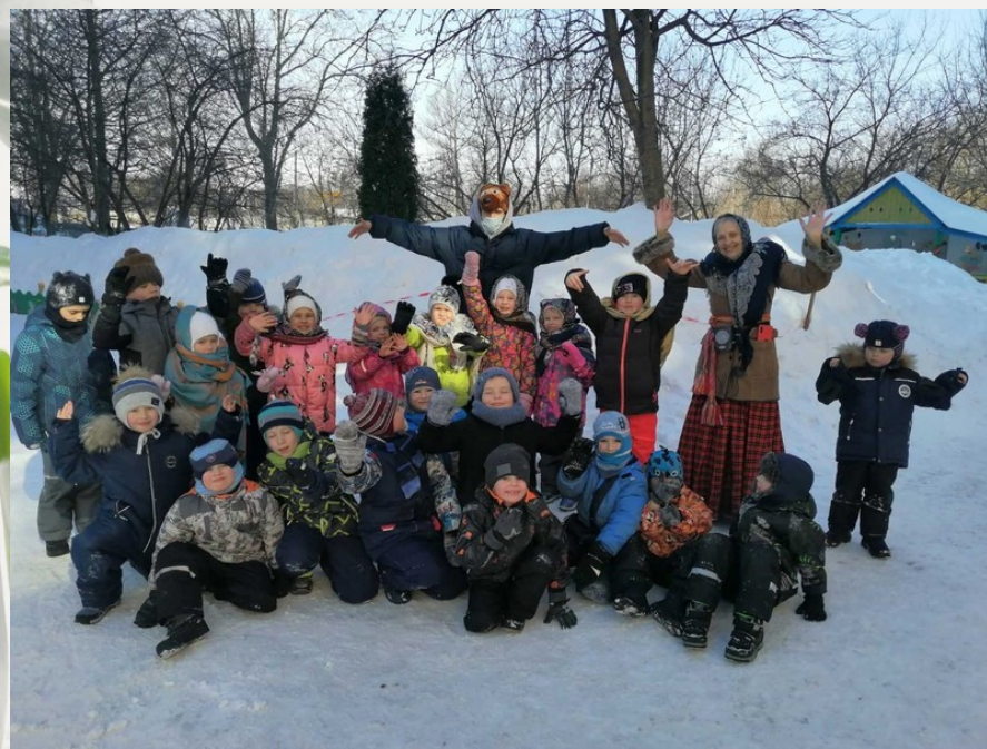
Прощай Зима сонливая!