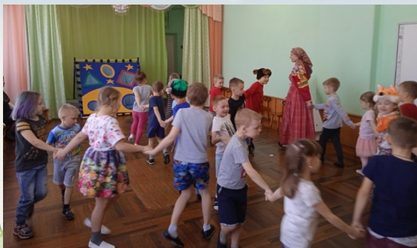
Сказка хороводная. Зрителей нет, все участники