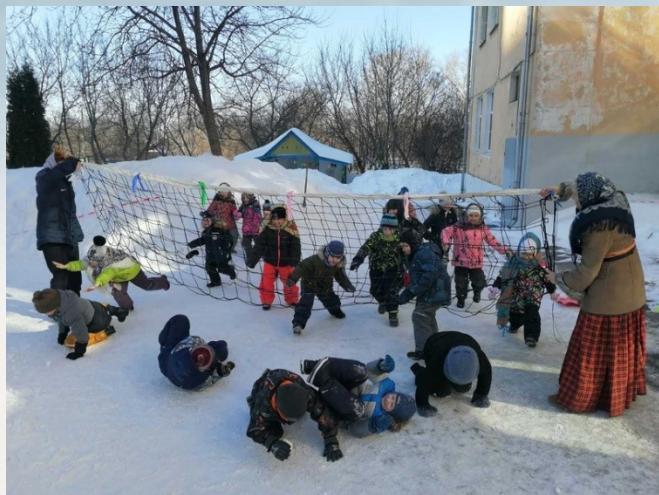
Игра «Рыбаки и рыбки»

Масленая неделя в Нижний прилетела, На пенечек села-оладушек съела, а блином закусила-дальше потрусила!