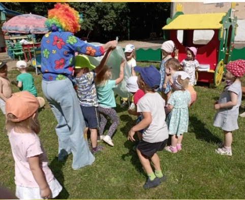
Игра «Лучики и тучка» Если Солнце не смеётся, Что с небес на землю льётся?