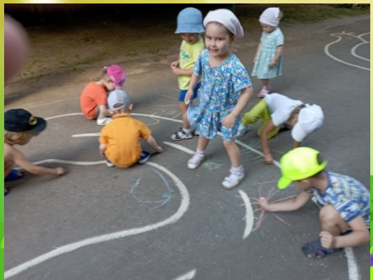
Рисуем на асфальте «Солнышко лучистое»