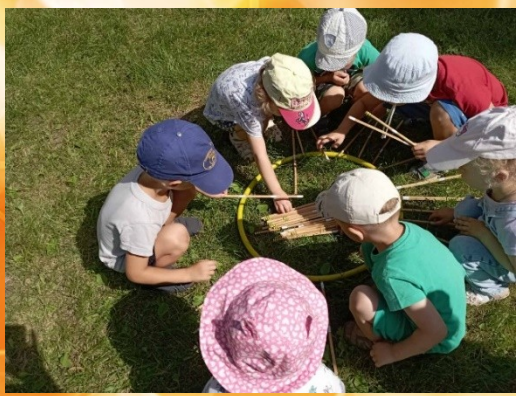
Игра с солнышком "Подари солнышку лучики"