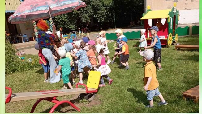
Игра «Пчелки и дождик» Пчелки, пчелки, поверху летают, К цветам припадают, нектар собирают, А дождь пошел, всех пчелок в улей увел.