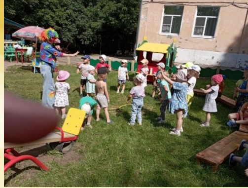
Пальчиковая игра «Вот где солнышко встает»