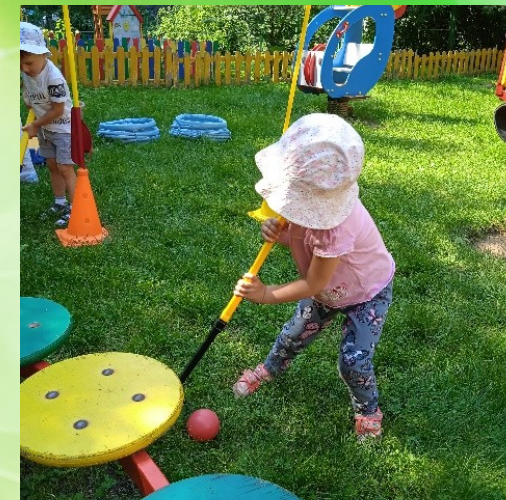
«Забей мяч в ворота»