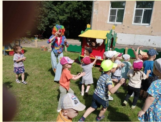
Игра «Поймай воздушный пузырь»