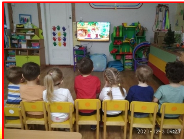
Просмотр обучающего мультфильма: «Уроки тётушки Совы»