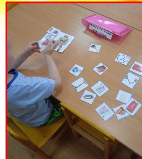
Игра: «Выбери то, что нужно пожарному».