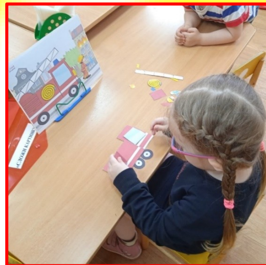
Игра: «Собери картинку. Пожарная машина».