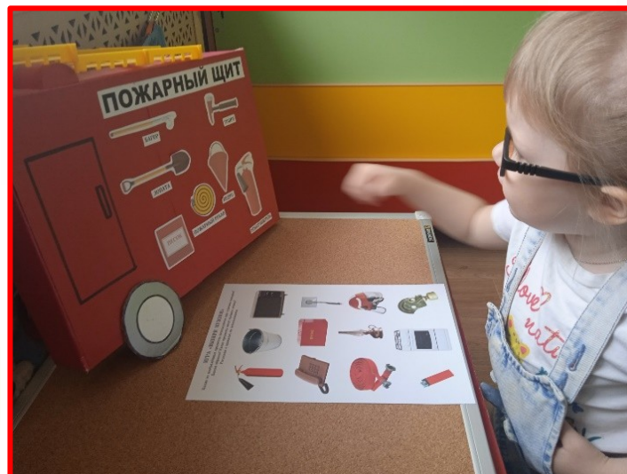
Игра: «найди одинаковый предмет».