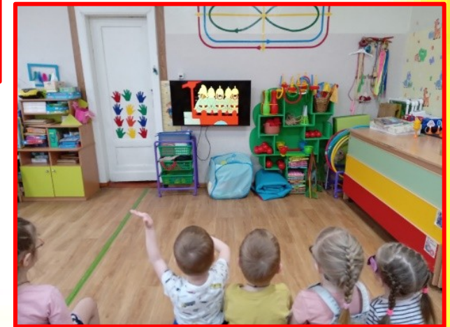
Просмотр мультфильма: «Кошкин дом»