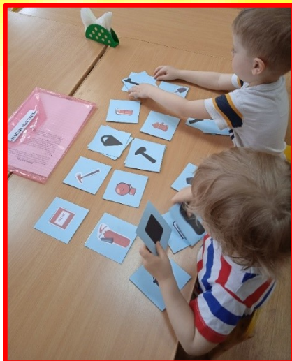
Игра: «Найди чья тень».