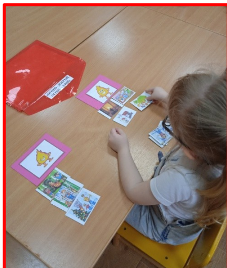
Игра: «Огонь – добрый, огонь-злой».