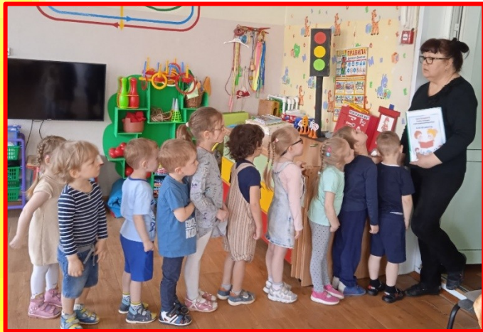
Учебная пожарная тревога.