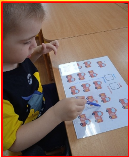
Игра: «Куда едут машины».