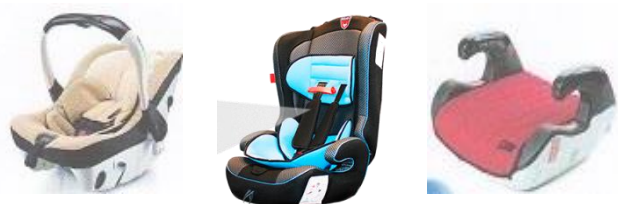
Автолюлька Автокресло Бустер